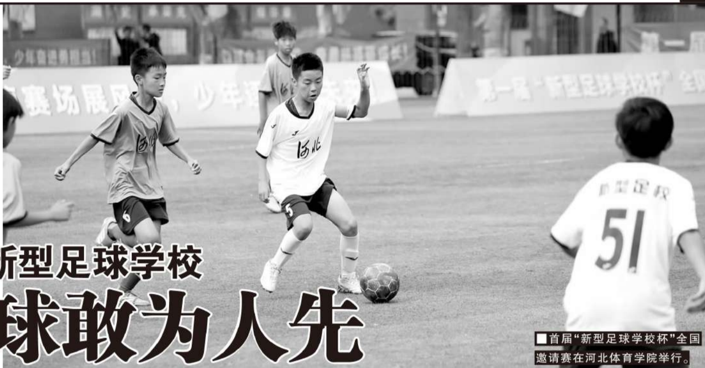
■首届“新型足球学校杯”全国邀请赛在河北体育学院举行。