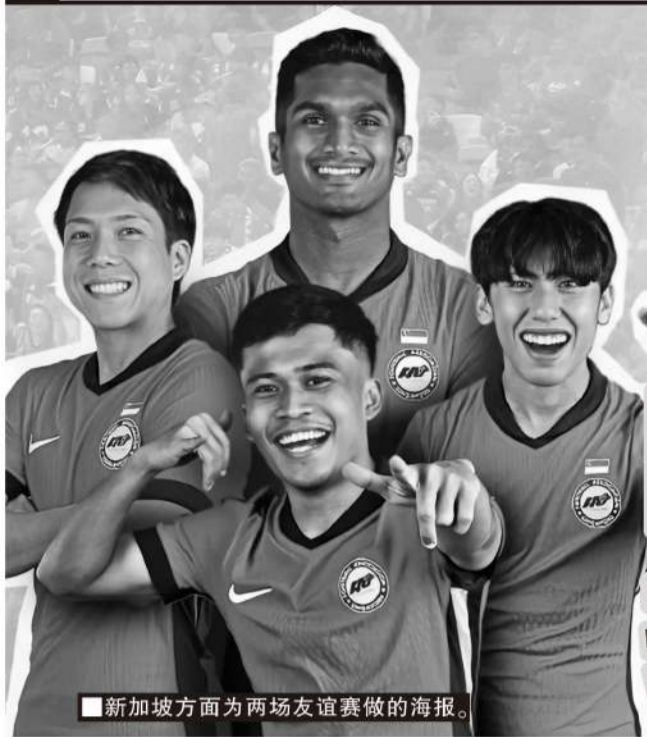
■新加坡方面为两场友谊赛做的海报。