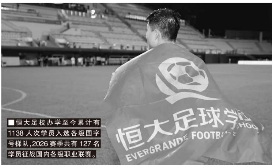
■恒大足校办学至今累计有1138人次学员入选各级国字号梯队,2026赛季共有127名学员征战国内各级职业联赛。

生直播照常进行。赛场之上,由恒大足校全资运营的广东晨星聚力创尔特队整装待发,这支以2008-09年龄段学员为班底组建的队伍,将于6月1日亮相中冠联赛,目标是向全国总决赛发起冲击,期望进入职业联赛体系。