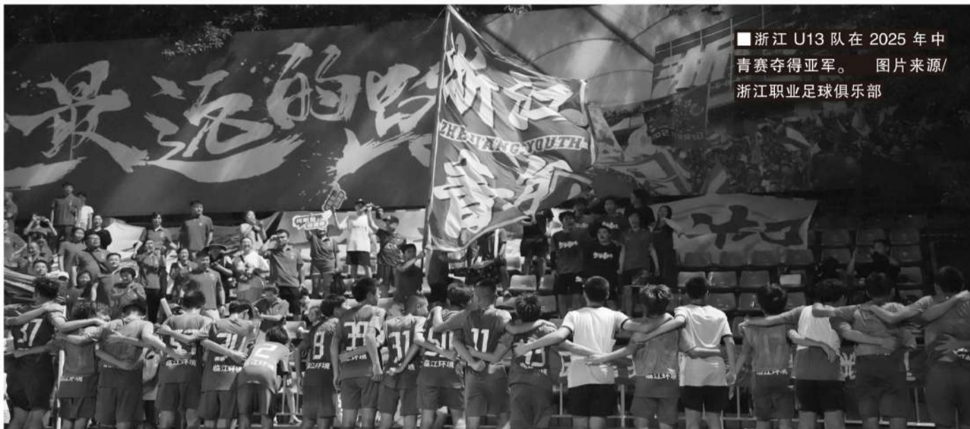
■浙江 U13 队在 2025 年中青赛夺得亚军。

训领域精益求精，也一直在探索如何把品牌价值转化为商业价值，那么在引入国资全面控股之后，如何借助自身的品牌价值和经验，“履行更大的社会责任，创造更高的社会价值”，成为俱乐部管理层思考的重大命题。