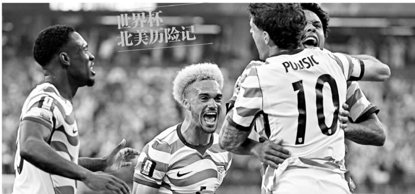
世界杯 北美历险记