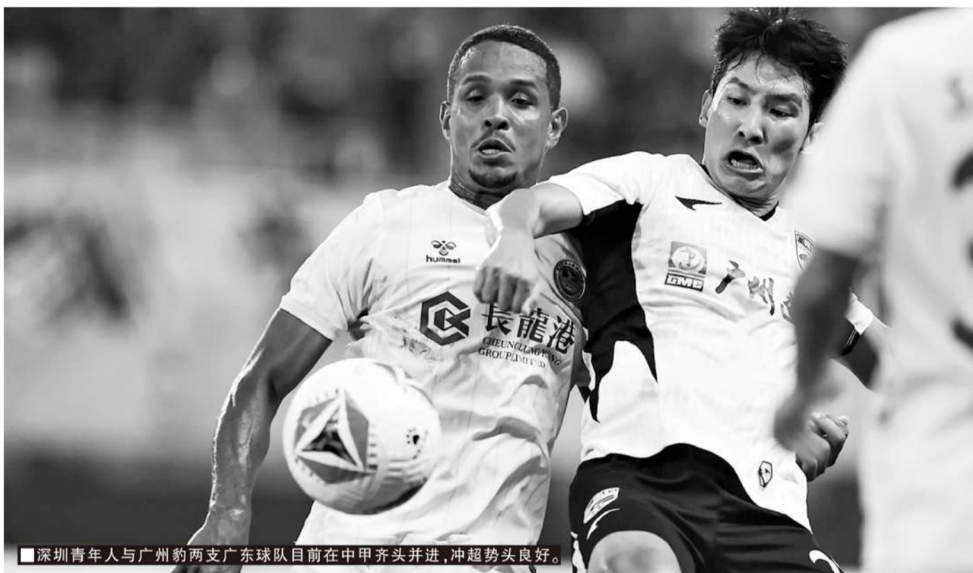
深圳青年人与广州豹两支广东球队目前在中甲齐头并进,中超势头良好。

作为中甲本赛季最大黑马,深圳青年人早在赛季前就凭借大投入完成阵容升级,如今他们位居积分榜前列,中超希望不小。