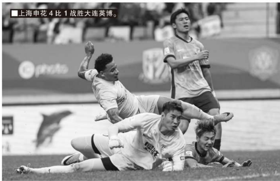
■上海申花4比1战胜大连英博。

无法和世界主流水平相比的当下，提升联赛的悬念自然是重中之重，河南彩陶坊和深圳新鹏城的坚韧表现，以及天津津门虎和武汉三镇的求生欲，在本轮都引发了不小的讨论。阻击强队也是新赛季中超的主旋律，16轮战罢，成都蓉城胜场13场（胜率81.25%）还算不错，其他强队山东泰山胜场8场（胜率50%），上海申花胜场7场（43.25%），北京国安和浙江绿城胜场只有6场（37.5%），上海海港胜场更是只有5场（胜率31.25%）。