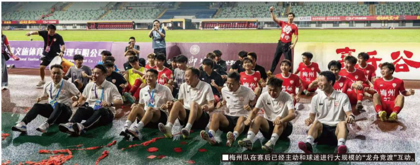
■梅州队在赛后已经主动和球迷进行大规模的“龙舟竞渡”互动。

汹涌的世界杯流量，对粤超而言不是迎面而来的滔天巨澜，而应是“借力化力”的顺势而为。通过足球关注度的错峰借势引流，继续深耕粤超独有的文化、地域差异化优势，实现从前期赛事密集时段的流量对冲，转变为承接世界杯流量为粤超流量，进而迎来暑假广东文旅高峰带动粤超发展的流量反哺。