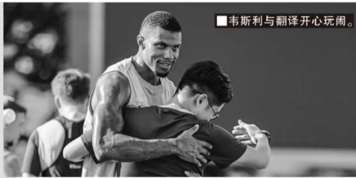
■ 韦斯利与翻译开心玩闹。

来到深圳生活一段时间,饮食、语言、城市氛围适应得如何?闲暇有哪些放松方式,是否体验过深圳本地特色文化?