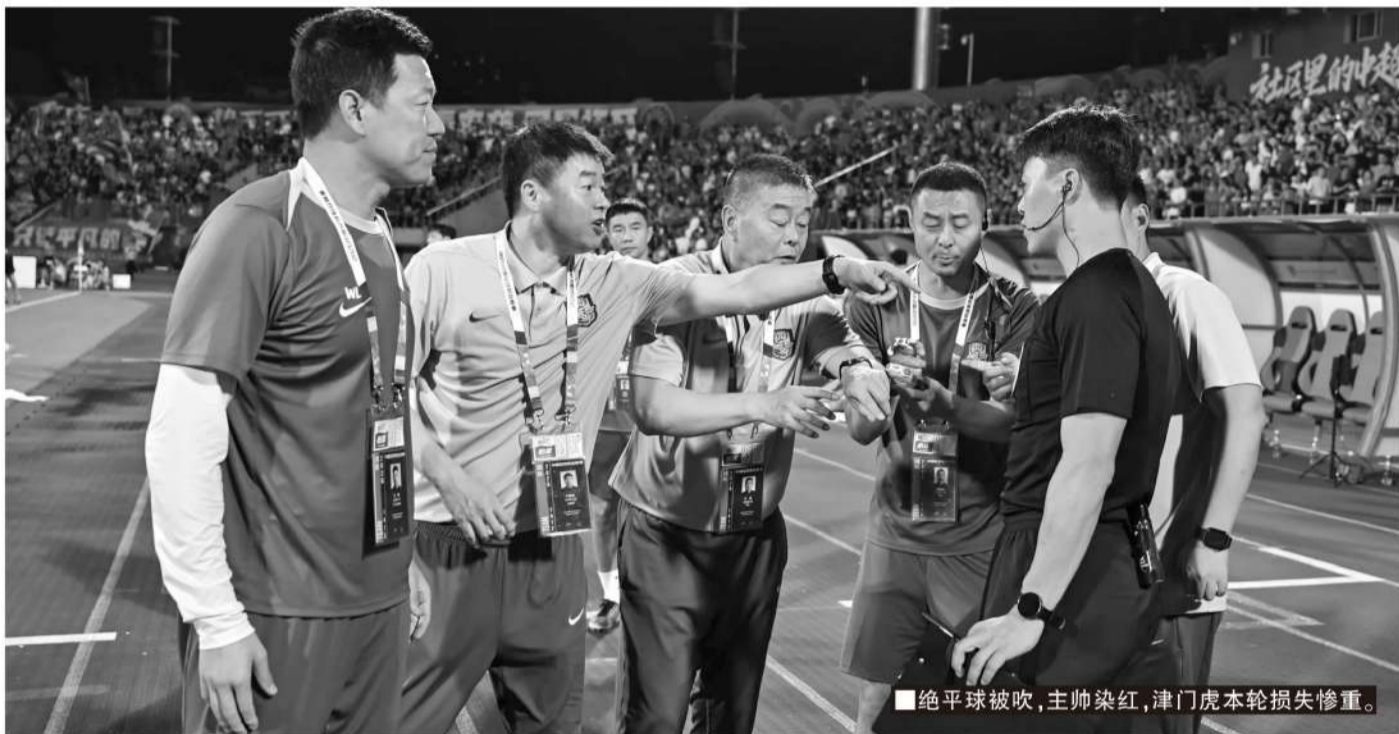
■绝平球被吹，主帅染红，津门虎本轮损失惨重。

纵观全场，间歇期调整仅小幅提升球队中场硬度，进攻乏力、阵容厚度不足的核心短板未能改善。目前津门虎账面积分仅5分，与倒数第三的海牛积分差已经来到8分，保级压力巨大。