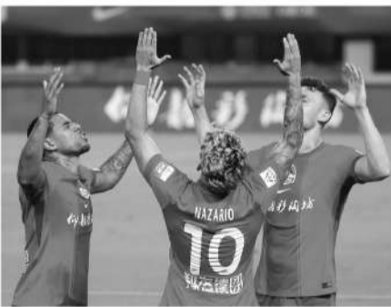
■古斯塔沃和姆布拉上半程的表现让球迷失望。

《足球》：你也提到了锋线外援效率问题，比如古斯塔沃之前也多次错失关键得分机会，外界对他一直存在质疑，你如何帮助他调整状态？