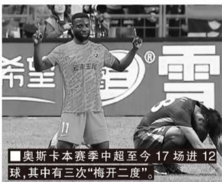
奥斯卡本赛季中超至今17场进12球，其中有三次“梅开二度”。

过几年，另一个在比利时没踢出来就改行了，还有一个在延边受过重伤，手术以后的康复情况不理想，两年后就退出了足球圈。他们都过早地离开了足球，而我是最幸运的一个。