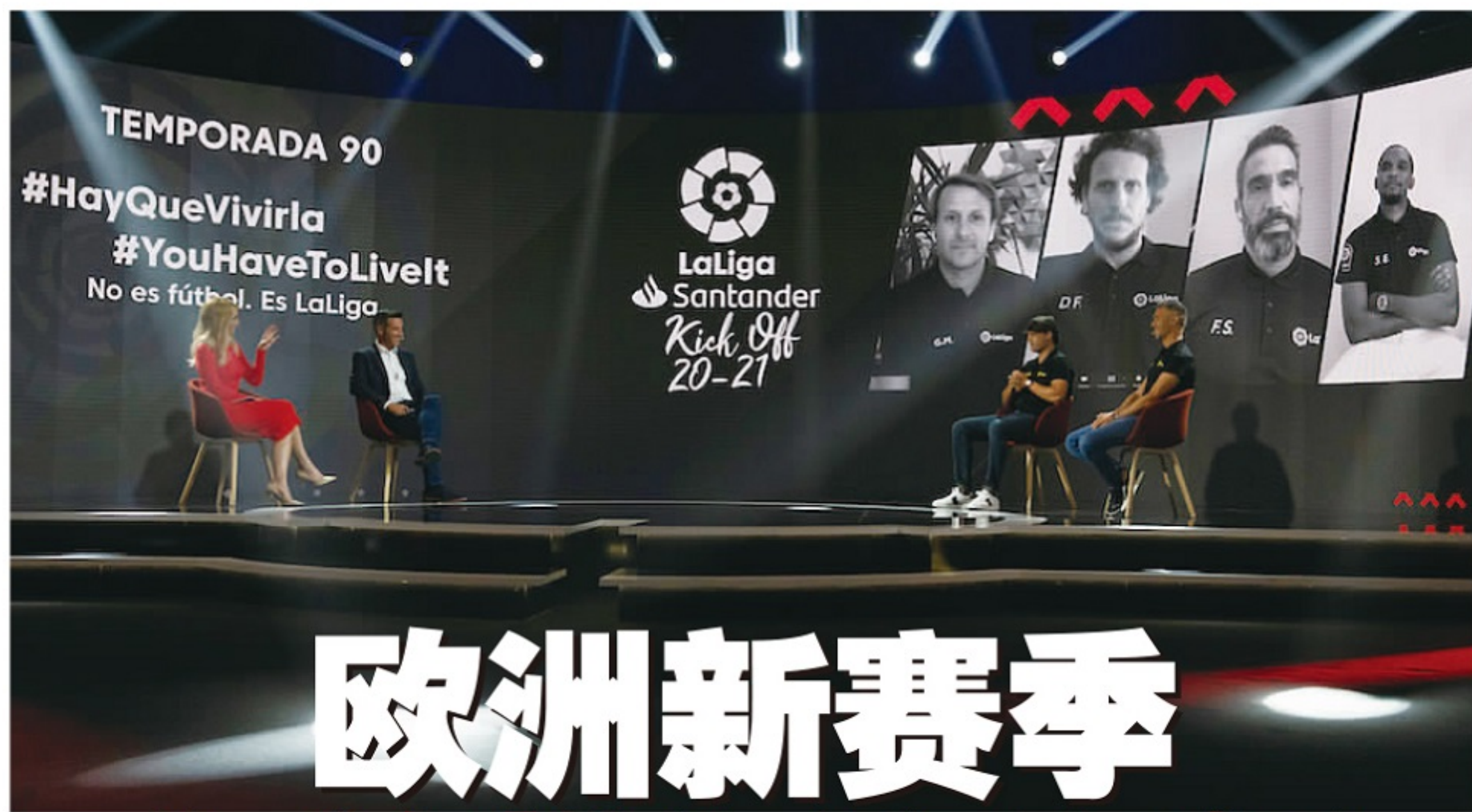
在疫情影响下,为迎接西甲新赛季的到来,西班牙

五大联赛组织方下定决心要保住联赛顺利如期完赛,哪怕付出继续空场比赛的代价,也在所不惜。无他,因为足球产业实在是经不起第二次停摆或腰斩的折腾了。