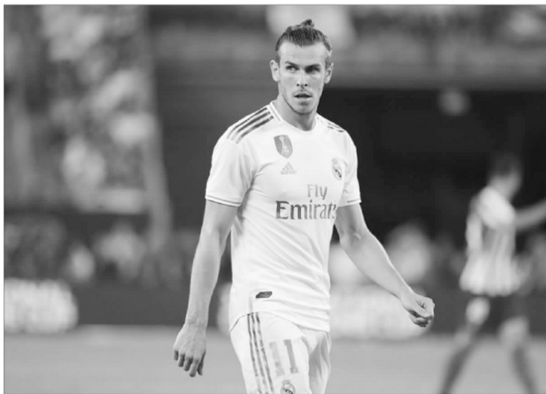
◆贝尔连续剧能否在中超收尾？

除了可能与皇马解约获得自由身的贝尔，7月1日已自由的乌拉圭巨星卡瓦尼目前还处于失业状态。他曾与本菲卡谈判，并没达成协议。格雷米奥、马竞、尤文图斯和国米都曾与卡瓦尼联系过，同样没有结果。相比状态每况愈下的贝尔，卡瓦尼最近十年的进球率非常稳定，前9年都在20球以上，甚至有两年在40球以上。上赛季被