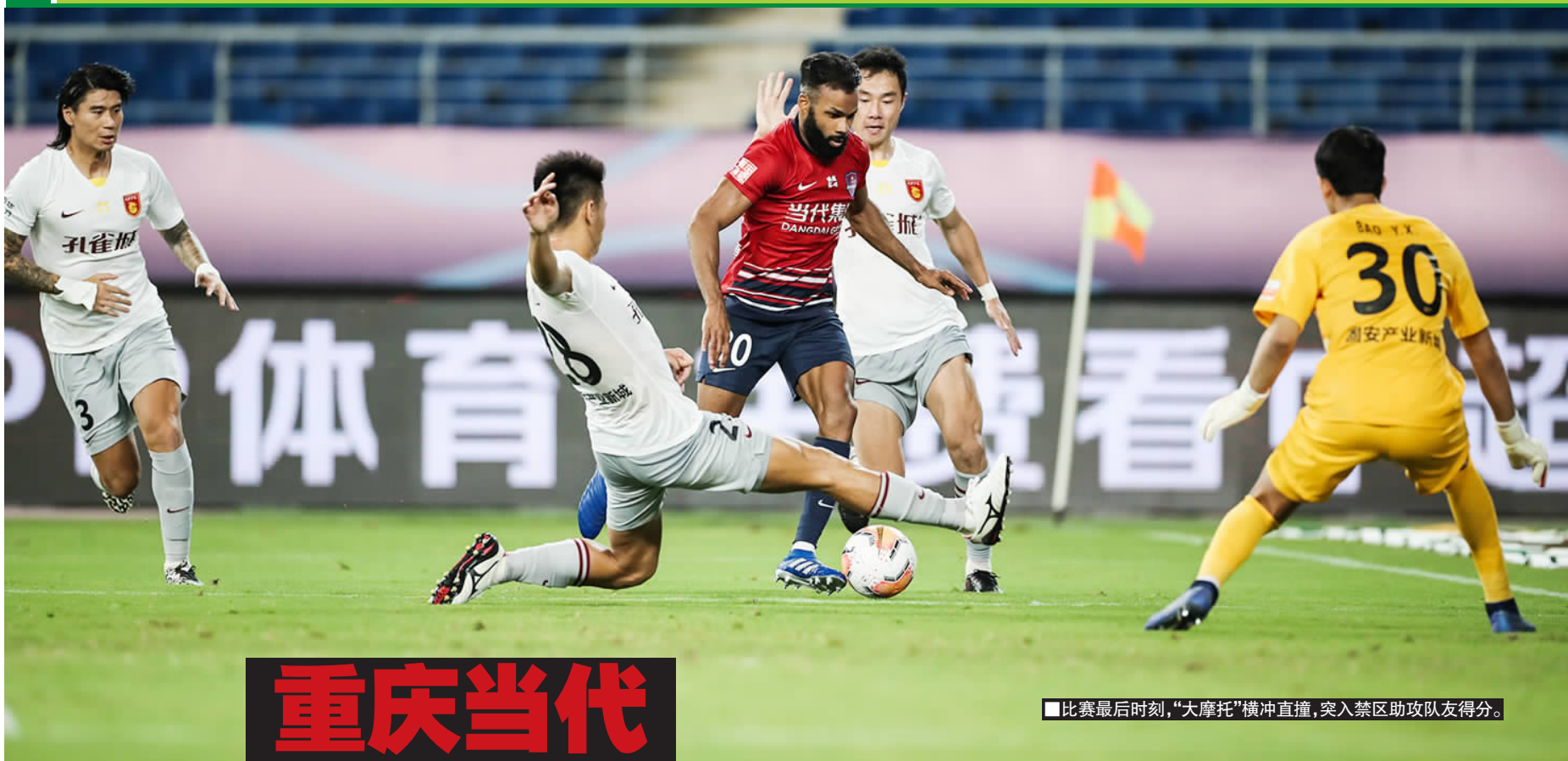
■比赛最后时刻，“大摩托”横冲直撞，突入禁区助攻队友得分。