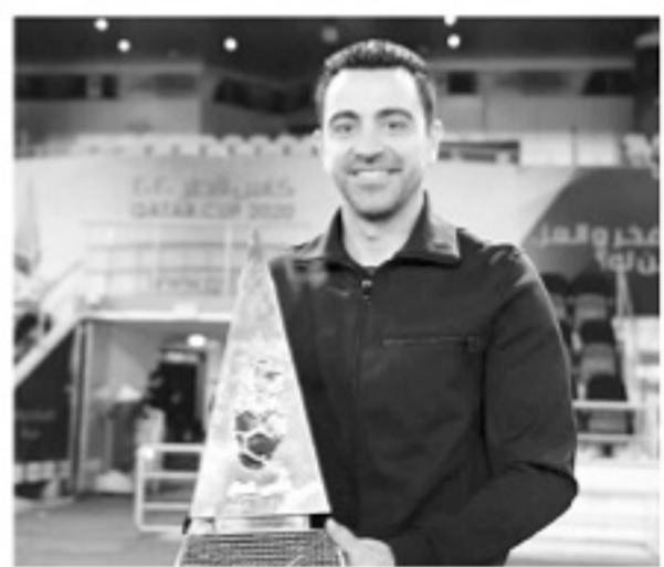
◆巴萨上下对哈维寄予厚望。

巴托梅乌能做的只有全力配合科曼的重建计划，但首先要面对的是10月25日的董事会。巴萨的新赛季预算将决定赛季走向，可上赛季收入预期剧减3亿欧元的巴萨，其实很难在资金