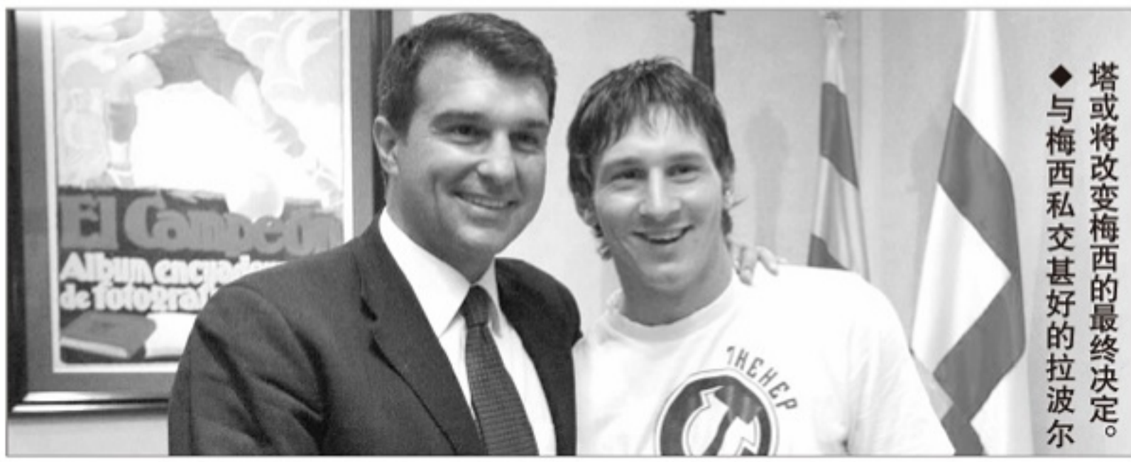
◆塔或将改变梅西的最终决定。与梅西私交甚好的拉波尔

拉波尔塔想要像17年前一样逆转，必须尽快得到 Mediapro 集团明确的支持。毕竟双方有共同的敌人——巴托梅乌，后者在2015/16赛季就终结了 Mediapro 对西甲和巴萨的转播权，转让给了西班牙电信 Telefonica。同时，罗塞尔对克鲁伊夫的冒犯，让巴萨在巴托梅乌时代失去了拉波尔塔时代的拉马西亚传承。但现在，这将是拉波尔塔的优势。他将重新让克鲁伊夫的名字响彻诺坎普，这也是他胜选最大的希望。