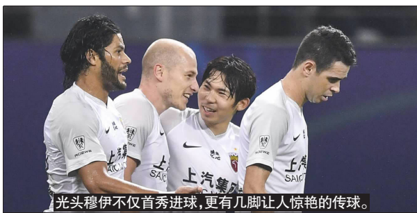
光头穆伊不仅首秀进球,更有几脚让人惊艳的传球。

能无法打满90分钟,所以我们也谨慎注意他的身体状况。穆伊是一名非常聪明的球员,脚下技术很出色,瞬间的决定也很不错,我对他的表现很满意。”