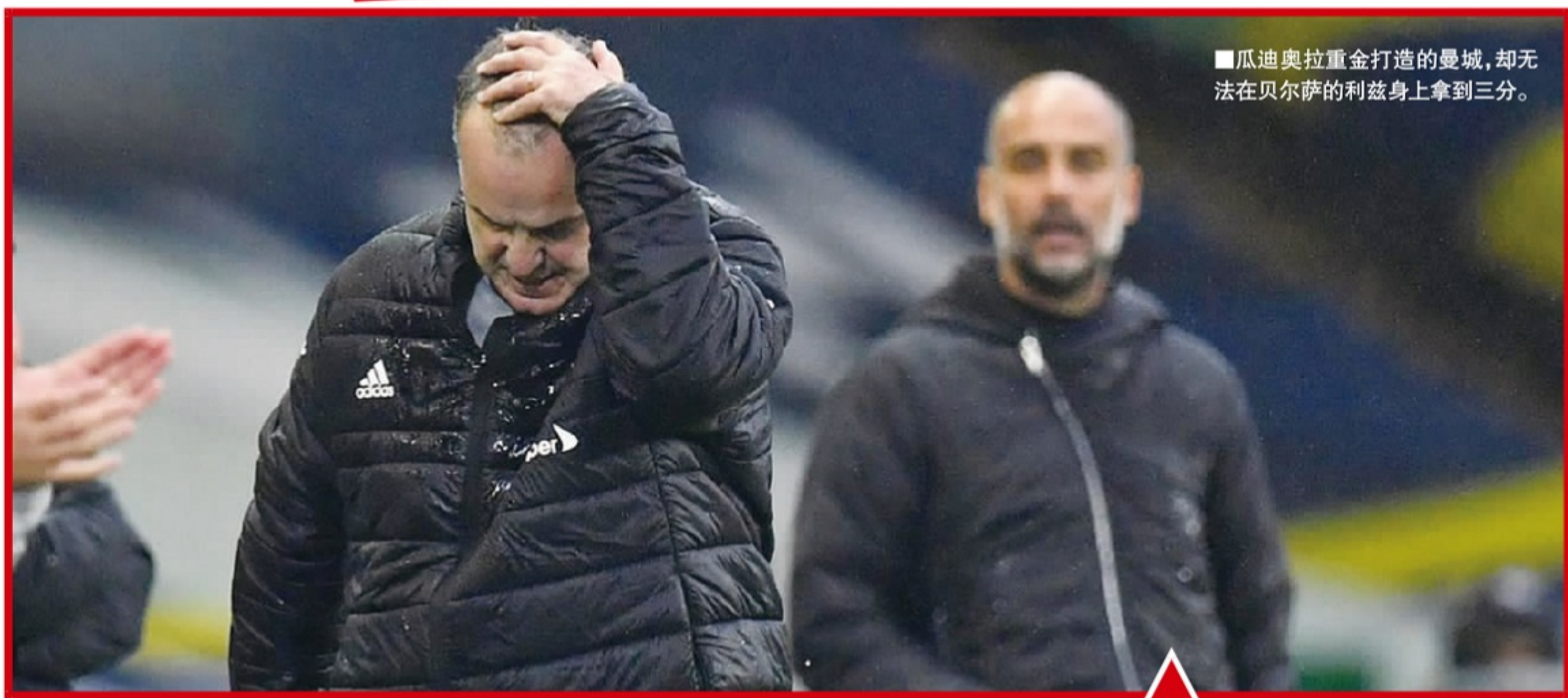
瓜迪奥拉重金打造的曼城,却无法在贝尔萨的利兹联身上拿到三分。