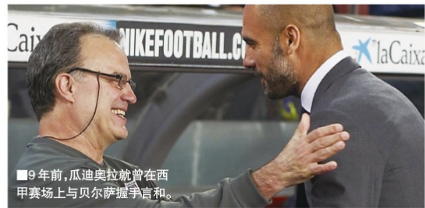
9年前,瓜迪奥拉就曾在西甲赛场上与贝尔萨握手言和。

自执教曼城以来,瓜迪奥拉已经为后防线总投入超过4亿英镑,引进了9名后卫球员,但赛季初这样的防守表现,的确让球迷担心本赛季争夺冠军的希望。利物浦开局保持不错的状态;埃弗顿后来居上,是目前英超最炙手可热的球队;兰帕德的切尔西青春风暴同样在身后虎视眈眈——英超的竞争,空前激烈。而曼城尽管有一亿欧元的防线投资,以及引进费兰·托雷斯弥补大卫·席尔瓦离开的空缺,但开局的表现让人颇感失望,争冠,会不会又成口号?