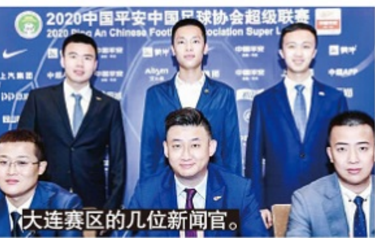
大连赛区的几位新闻官。