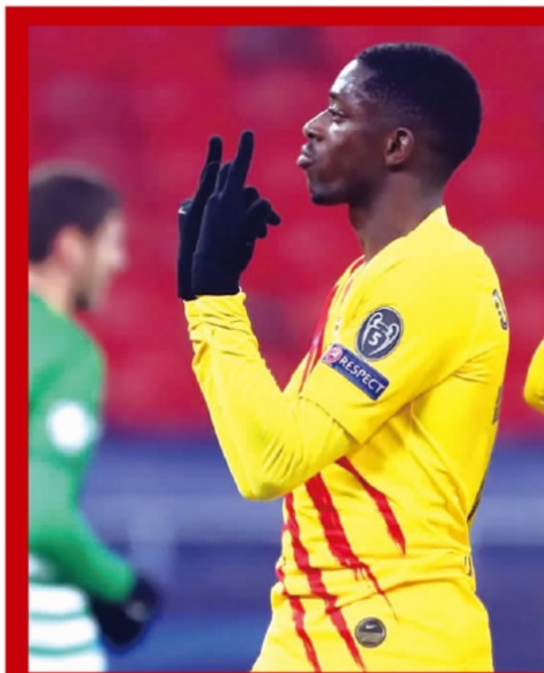
弗朗茨城 0 比 3 巴萨