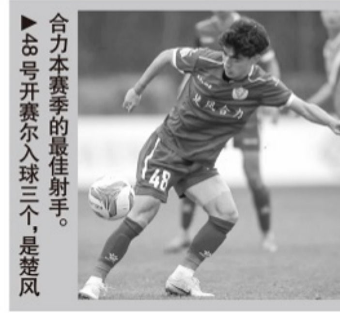
合力本赛季的最佳射手。48号开赛尔入球三个,是楚风

这样的一支中乙球队是让人欣慰的,楚风合力方面告诉记者:“其实本赛季中乙赛程密集,比赛场次较少,各队备战过程中都面临不小困难,不过,球员们的努力和拼搏以及他们的成长还是让人欣慰的。2021赛季,我们希望在去年的基础上有更加明显的进步。”