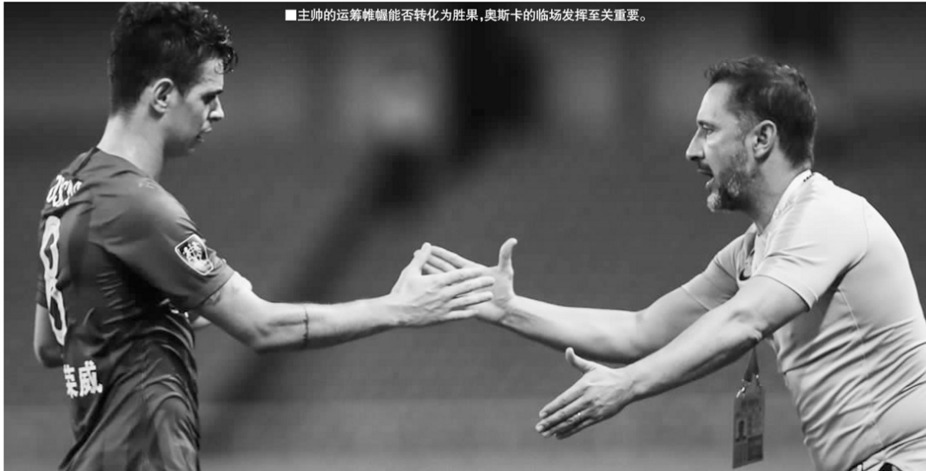
■主帅的运筹帷幄能否转化为胜果,奥斯卡的临场发挥至关重要。

对阵神户胜利船,两队是首次碰面,这也跟神户胜利船首次参加亚冠有关系。不过,上港参加亚冠以来,先后跟日本球队交手过20次,成绩取得9胜5平6负,占据一定的优势,但是在淘汰赛,上港没有优势,此前4次在亚冠淘汰赛阶段面对日本球队,上港被淘汰3次,而且是最近连续3次都出局。2016赛季八分之一决赛两回合2比2,依靠客场进球多淘汰东京FC;2017赛季4强赛两回合1比2被浦和红钻淘汰;2018赛季