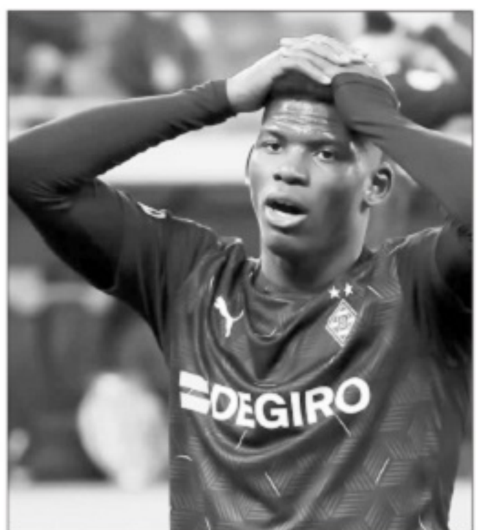
▲恩博洛在门兴没有获得理想的发展，渐有泯然众人的趋势。

罗泽能提前一年跳出合同离开，是因为合同中有500万欧元的违约金。如果请来新帅，违约金仍然是有可能的。埃贝尔说：“如果我们找到了一名百分百相信的新教练，认为他能在两到三年内带领球队继续前进。那我可以接受对方的违约金要求。但我们不会接受他一年就可以离开，那实在是太短了。”