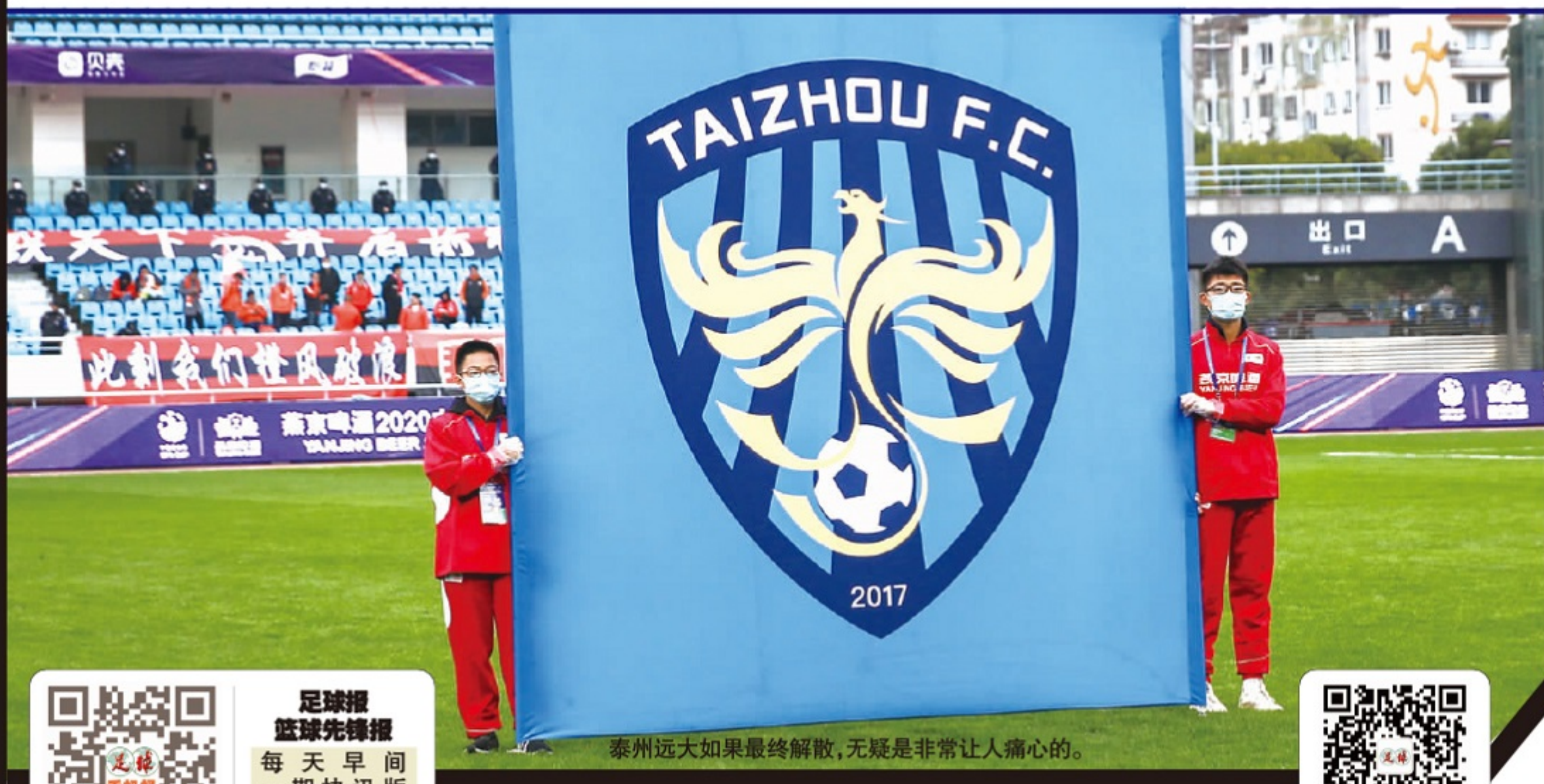
泰州远大如果最终解散,无疑是非常让人痛心的。

韩国足协对这次中韩奥运预选赛非常看重,因为韩国女足虽然参加过3次女足世界杯,但从未参加过奥运会女足决赛圈。此前6次奥运会预选赛,韩国女足均折戟预选赛,其中最接近是2004年雅典奥运会,韩国队在亚洲区预选赛半决赛被中国队1比0击败,与奥运会决赛圈一步之遥。这次,韩国女足将希望寄托在3位留洋球员身上。