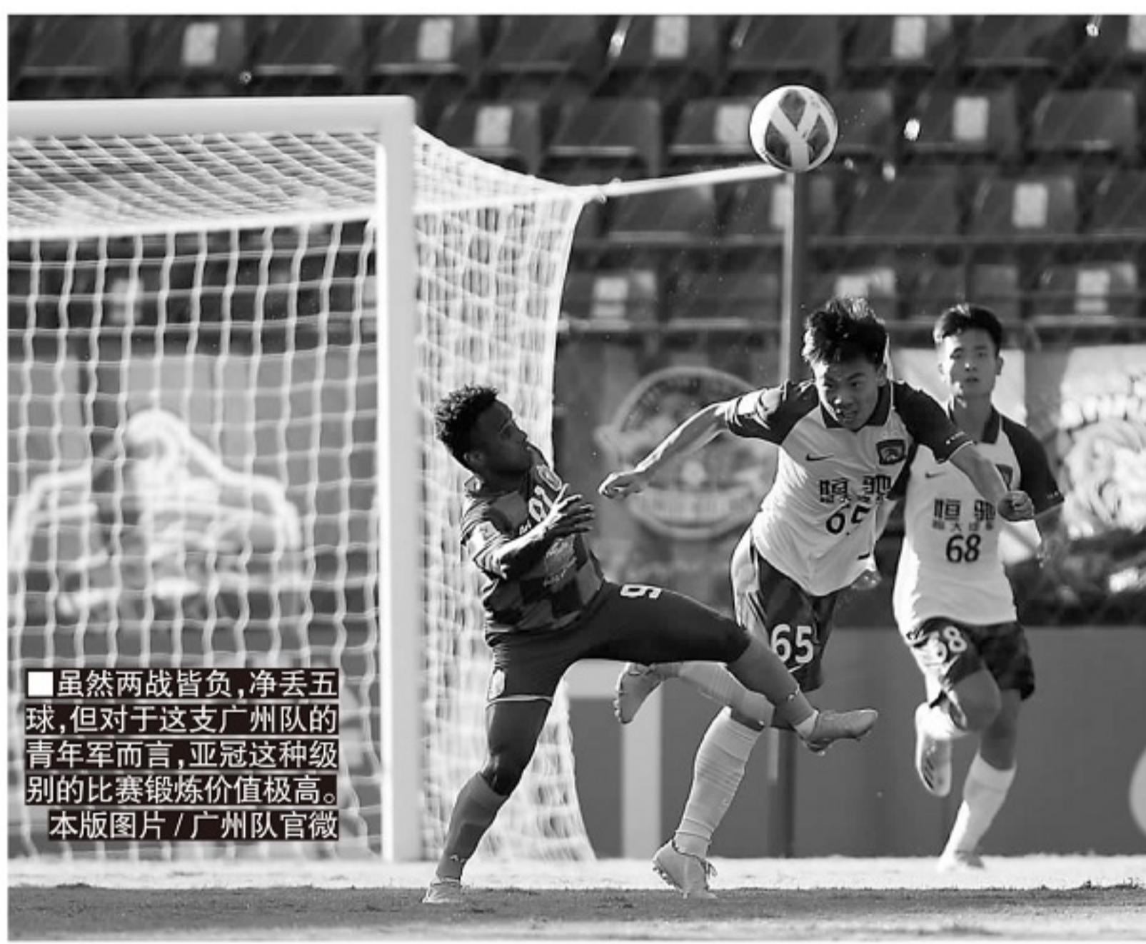
虽然两战皆负,净丢五球,但对于这支广州队的青年军而言,亚冠这种级别的比赛锻炼价值极高。

次战广州队,泰港自然想一雪前耻,在本土举办的亚冠上拿到队史首场胜利。深知对手来势汹汹的广州队,也是不敢怠慢,代