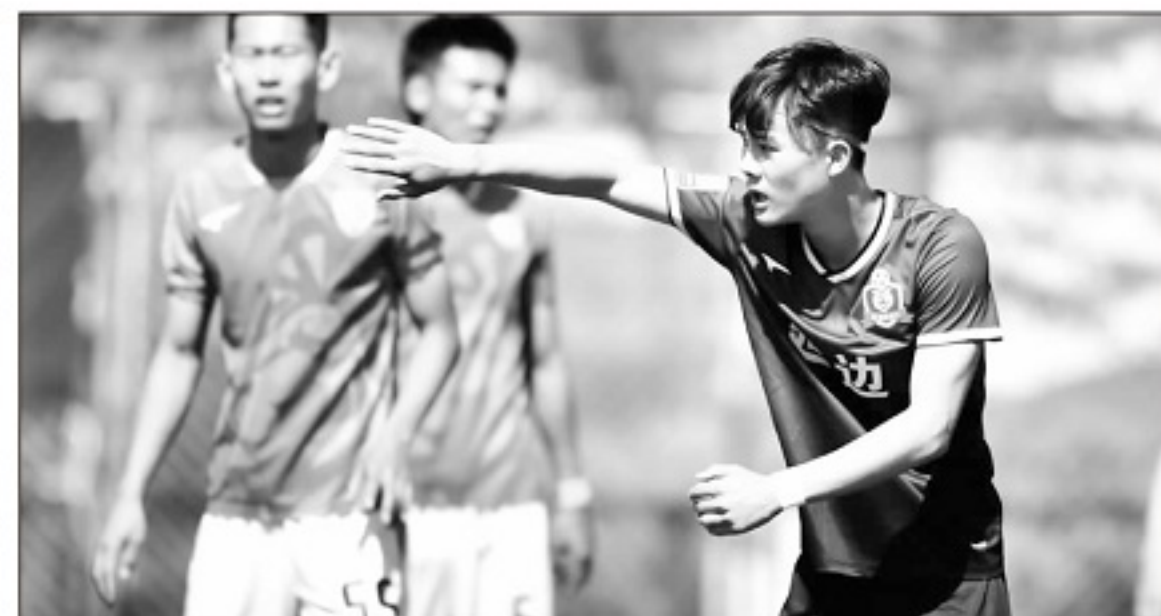
▲比赛中的新延足球员。