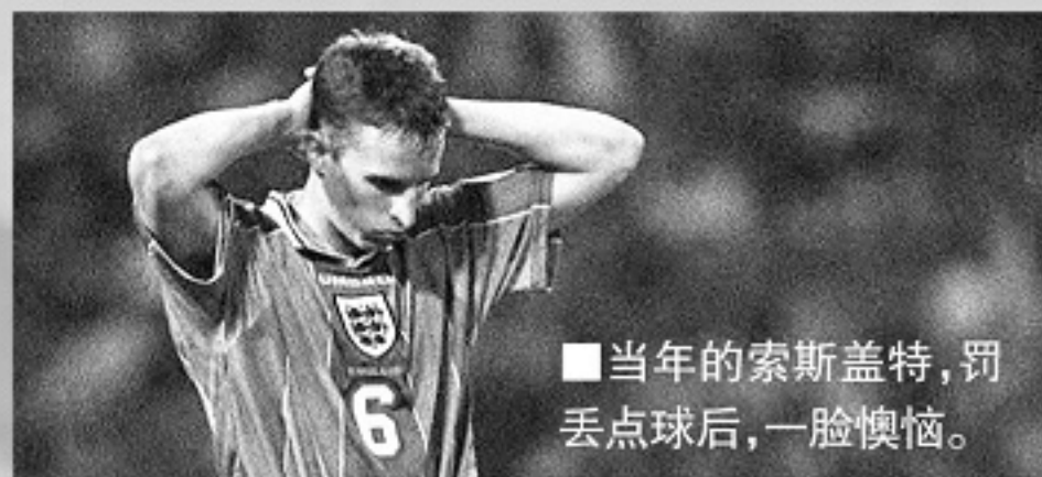
■当年的索斯盖特，罚丢点球后，一脸懊恼。