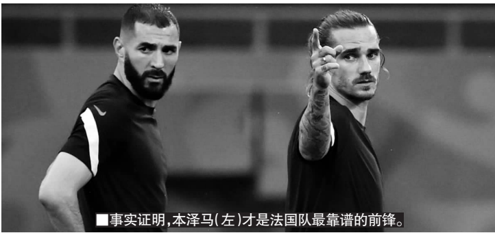
■事实证明,本泽马(左)才是法国队最靠谱的前锋。

齐达内还有一个无与伦比的优势,他是2022年卡塔尔世界杯的形象大使,加上卡塔尔近年来与法国在政治和经济上日益密切的联系,甚至包括了BeIN体育频道对法国足球的投资问题,法国足协选择齐达内都是多方共赢的结果。本周,法国足协与德尚的去留谈判,本质上就是齐达内的前任民意调查。连佩雷斯主席都出面为齐达内站台,法国足协还能犹豫什么呢?