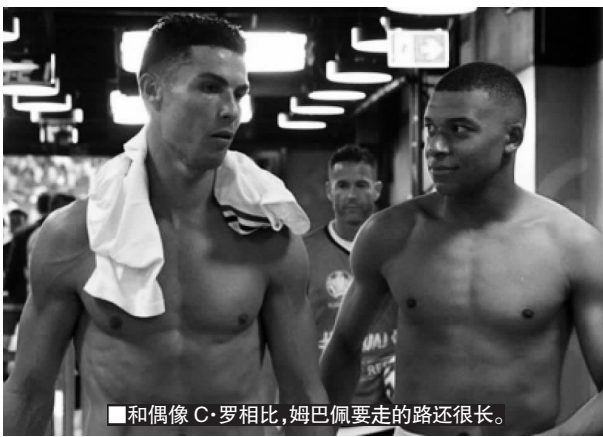
■和偶像 C·罗相比，姆巴佩要走的路还很长。

趁提前到来的假期，这个夏天，姆巴佩应该推开窗户，多仰望太空，更多沉浸于星辰大海。