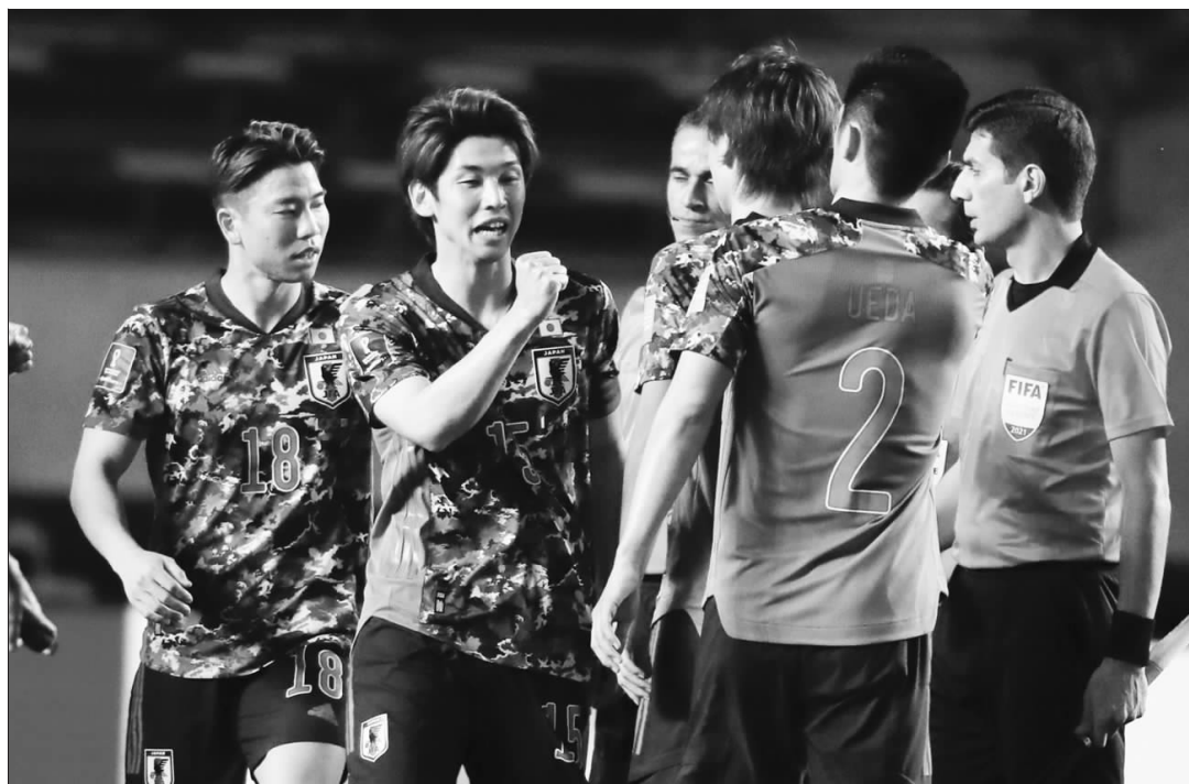
▲在世预赛40强赛对缅甸的比赛上，日本“全欧班”首发阵容凶猛。

务，因此，他们在2018俄罗斯世界杯后，选择了时任国奥主帅的森保一兼任国家队主帅一职，而日本足协给他的任务是：奥运奖牌和卡塔尔世界杯八强。随着本田圭佑、香川真司和长谷部诚等上代骨干的老去，森保一要选出下一代核心。