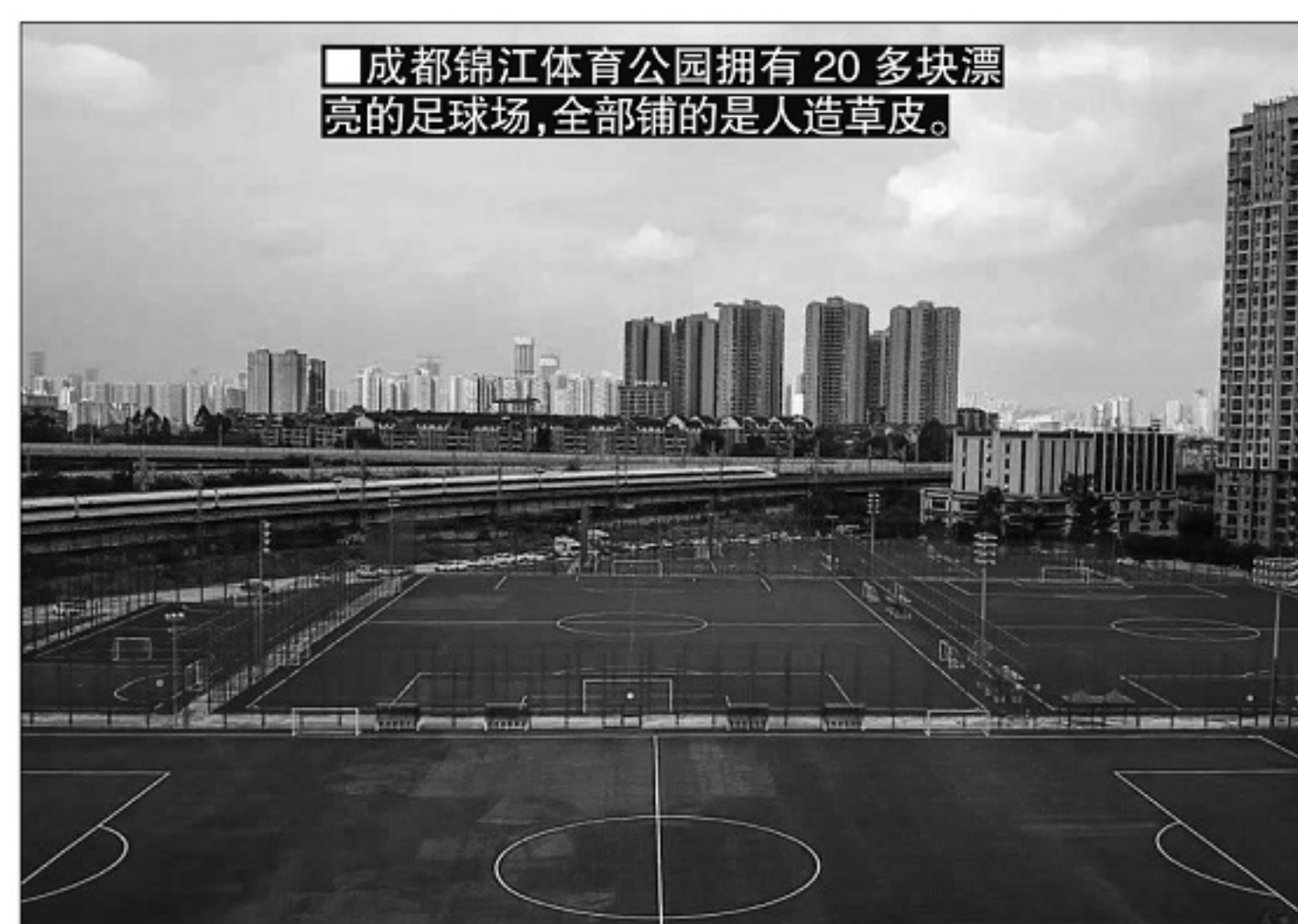
■成都锦江体育公园拥有20多块漂亮的足球场,全部铺的是人造草皮。

用,人造草皮的性能得到大幅改进,人造草球场重新受到关注,并很快就得到了国际足联以及欧足联的认同。2004年2月28日,国际足联在第118次全会上作出允许职业比赛使用人造草皮的决议。在2007年英格兰客场挑战俄罗斯的2008年欧洲杯预选赛上,欧足联允许俄罗斯方面使用拥有人造草皮的卢日尼基球场,而仅仅两年后欧足联方面也开始允许在俱乐部赛事中使用人造草皮。2015年女足世界杯成为国际足联的一次巨大尝试,所有6个赛场全部使用人造草皮。