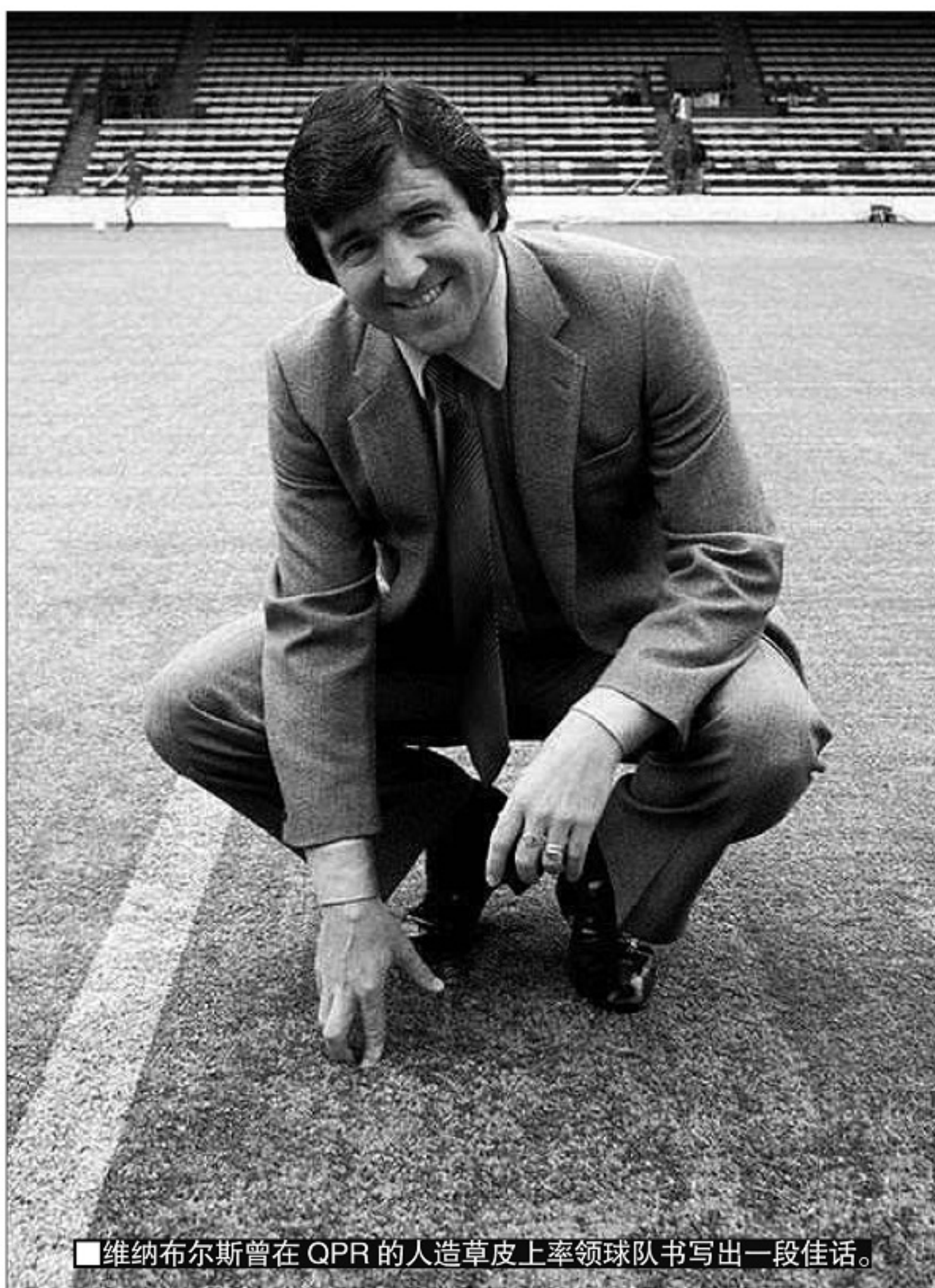
■维纳布斯曾在QPR的人造草皮上率领球队书写出一段佳话。