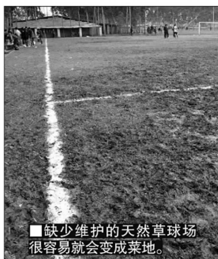
■缺少维护的天然草球场很容易就会变成菜地。

原来在上世纪七十年代末至八十年代初时,QPR主场洛夫特斯路球场的草皮生长情况十分不理想,甚至有的时候草皮根本没有生长的势头。实际上,伦敦城的寒冬与酷暑在上世纪七十年代中后期就开始令洛夫