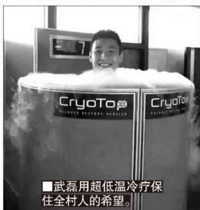
■武磊用超低温冷疗保住全村人的希望。

全民健身背景下,运动医疗市场也在急剧扩张。运动伤害最普遍的肌肉和关节损伤,正是超低温冷疗的用武之地。这种以往只能由职业运动员享用的高科技康复手段,如今已进入大众市场。而且这是普适性、全面性的理疗手段,可以通过局部和全身超低温冷疗,加速缓解疼痛,促进内循环,消除炎症,缩短康复周期。显然,能让C·罗保持超一流身体状态的超低温冷疗,也能让普通运动爱好者保持甚至提升自己的身体状态——超低温冷疗在中国,面对的是潜力无限的“蓝海”。