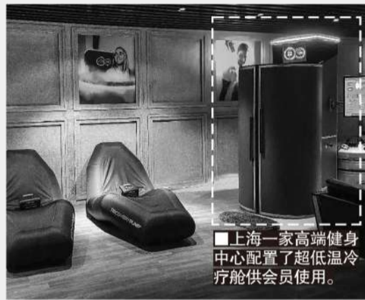
■上海一家高端健身中心配置了超低温冷疗舱供会员使用。

目前国内的超低温冷疗设备仍然以进口为主,相应价格也比较昂贵。2019年,CBA的广东宏远引进的全身超低温冷疗舱,价格超过80万。即便是局部冷疗设备,价格也超过20万,但考虑到市场的广阔,还是非常值得投资。英国的CryoTop,德国的Mecotec,都在欧美占据了超低温冷疗市场相当大的