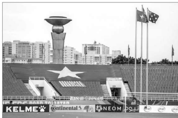
▲越南美亭体育场草皮已翻新。