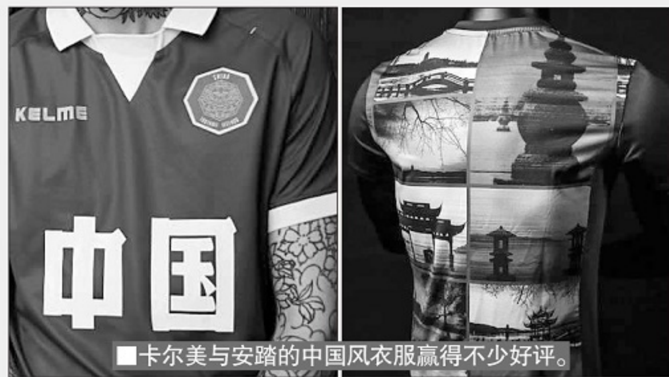
■卡尔美与安踏的中国风衣服赢得不少好评。

虽然国际运动品牌已经全面关注中国风的潮流，但从对中国文化的理解到具体的设计方面，国产品牌甚至更胜一筹。运动品牌的中国文化展示，也应该从最浅表的图案、字体向更深层的意境进步。