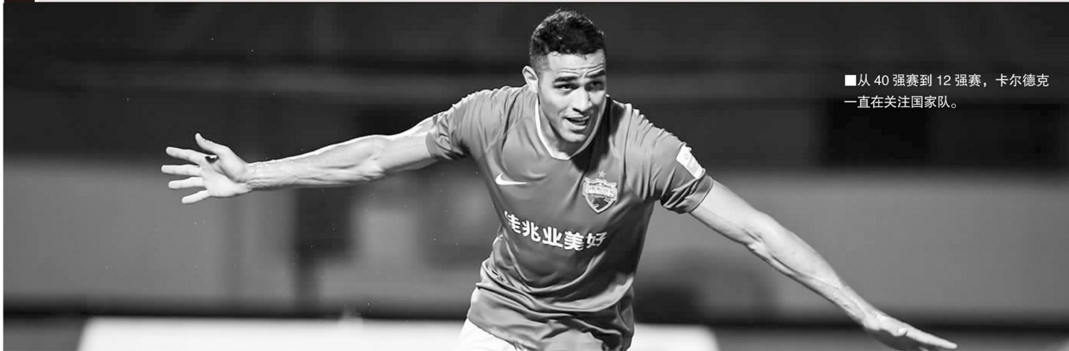
■从40强赛到12强赛，卡尔德克一直在关注国家队。