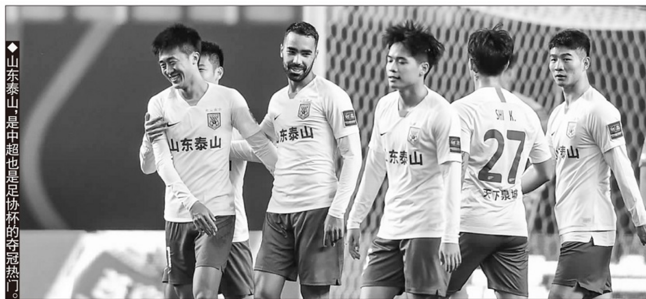
◆山东泰山是中超也是足协杯的夺冠热门。

足协杯的历史上,泰山队和河南队交锋2次,2015赛季1/4决赛,双方1比1战平,泰山队凭借点球决战晋级;2011年足协