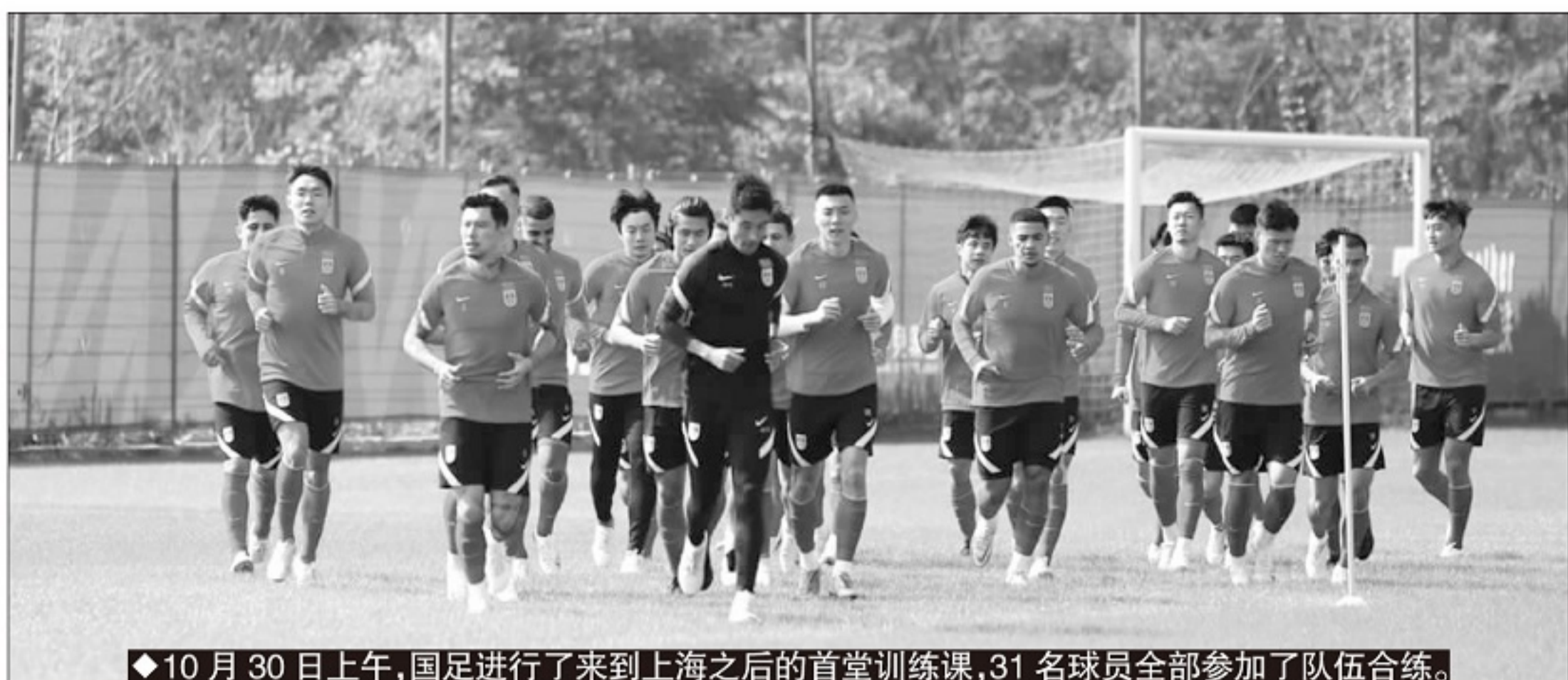
◆10月30日上午，国足进行了来到上海之后的首堂训练课，31名球员全部参加了队伍合练。

在第3轮对阵越南队之前，国足有了一个月的准备时间，击败这个小组实力最弱的越南队也属应有之义，但到了第4轮和沙特的比赛，因为归化球员的出色表现，李铁的用人又引发了普