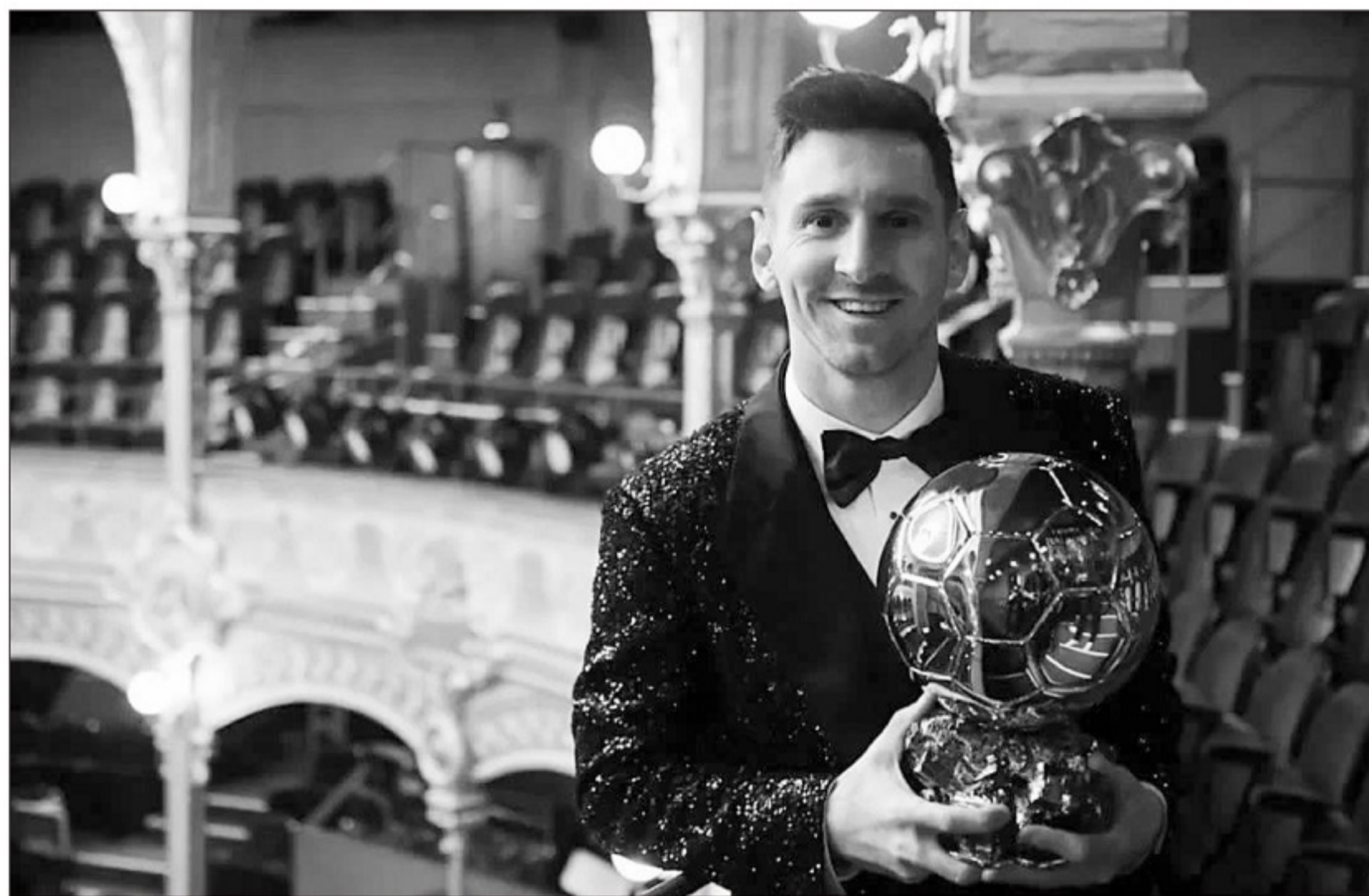
■很多人往往只看到梅西七捧金球奖的风光,却忽视了梅西在生活和训练中的付出。

对于梅西随着年龄增长,发作频率逐渐升高的呕吐,波塞尔认为与梅西此前的饮食习惯密切相关。这是生活在南美的人们常见的不良饮食习惯——过度食用肉类,导致难以消化。同时,糖分摄入也偏多,还有食用精制面粉,这些食物导致梅西在神经高度紧张的比赛中,胃部不适。波塞尔宣称,梅西只要坚持执行自己的营养方案,不仅能根治呕吐症,职业生命也能保持得更久。