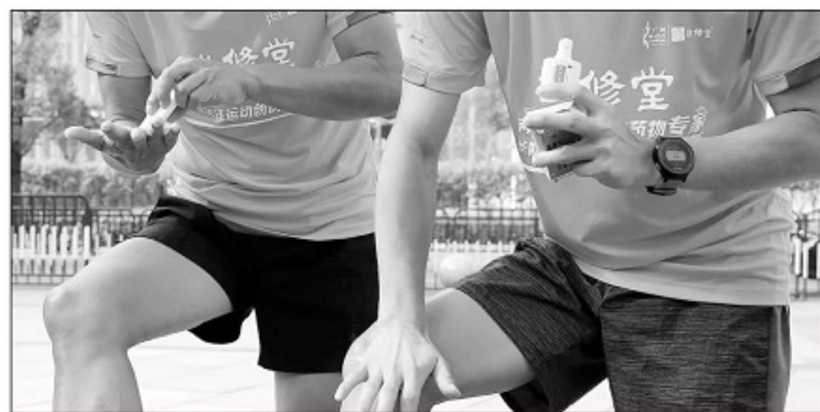
■运动前后涂抹跌打万花油可以预防和修复运动创伤。

从小到大，笔者家里的小药箱，感冒咳嗽等药物换过各种各样的，但敬修堂的跌打万花油一直没有被替换过，这在华南地区很多家庭当中其实是相当常见的现象。另外，敬修堂的跌打万花油实在太过深入人心，以致于