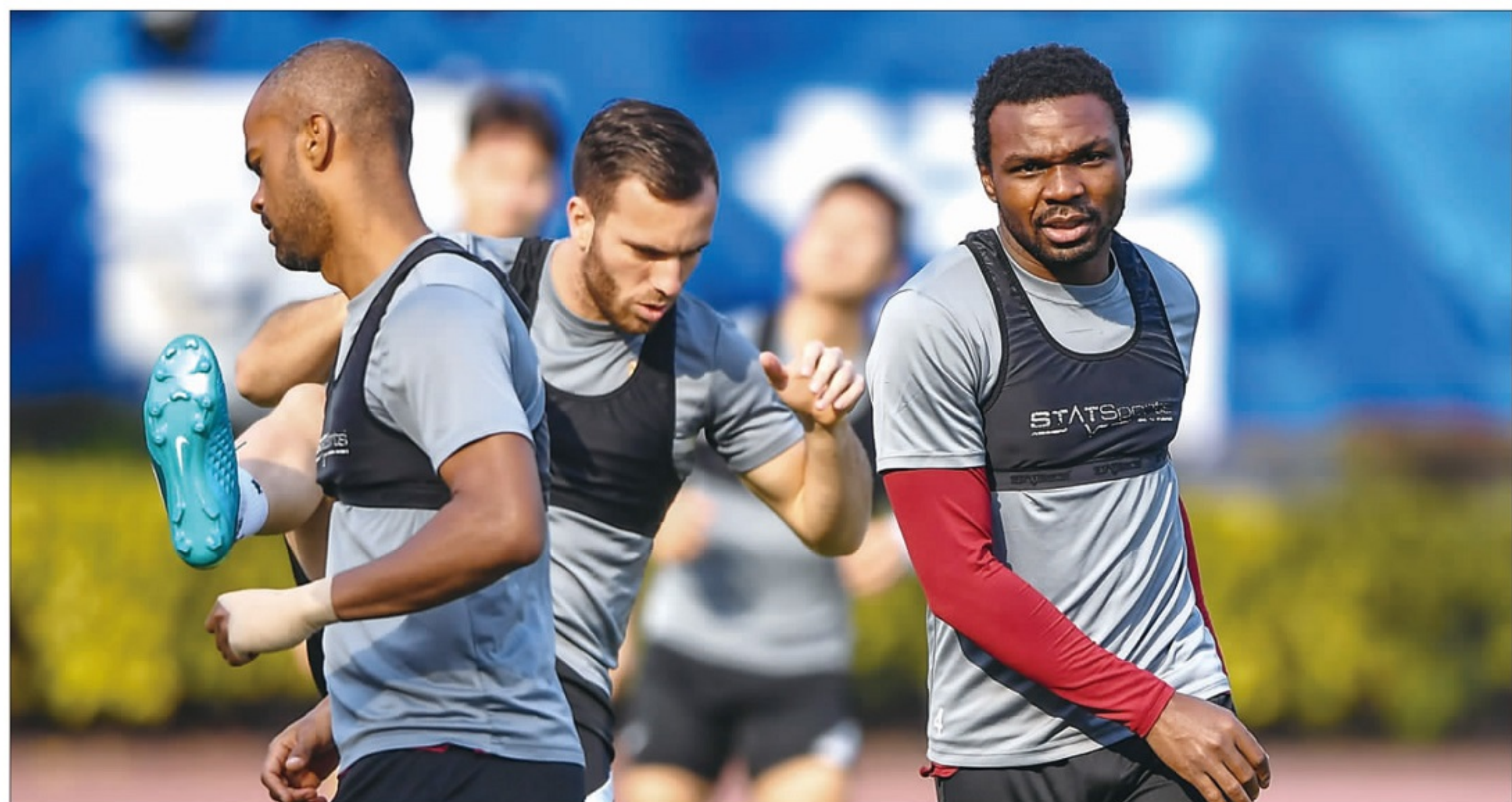
▲亚泰的外援军团磨刀霍霍。

为了应对这种可预见的挑战,亚泰早在10月26日就从长春转战上海金山驻训。在那里,主教练陈洋带领弟子潜心备战了5个星期,其间与海港和国安