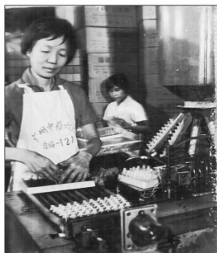
■（1966年敬修堂并入广州中药总厂后曾改名为中药六厂）上世纪60年代，工人在生产万花油。

在“跌打万花油”1955年的仿单广告纸上，记载着当年留传下来的跌打万花油的用药说明。关于药方，仿单上面是这么介绍的：“万花油乃少林寺师傅之秘方也……其味纯，其功峻，而其力则驾乎诸药油之上”。对“刀伤出血、跌打肿痛、风湿骨痛、烫火烧伤、冻伤肿痛、皮肤烂肉”等不同皮外伤症状，万花油“无不奏效如神”。