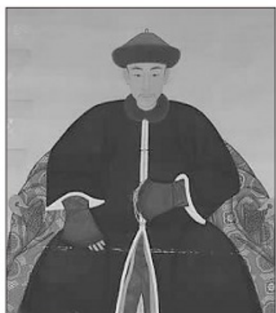
■洪熙官的曾徒孙蔡忠是清末五大伤科名家之一，他根据洪熙官的药油秘方研制出跌打万花油。

洪熙官是广东花县（现广州花都）人，自幼师从著名拳师蔡九仪学习少林武功，后来成为“少林十虎”之首，排第2的是方世玉。由于对当朝统治人极为仇视，为了对抗清廷、提高徒弟武功，1668年蔡九仪带领血气方刚的少年洪熙官等人去到郑成功跟清兵作拉锯战的闽南，在泉州南少林寺进一步修习武功。