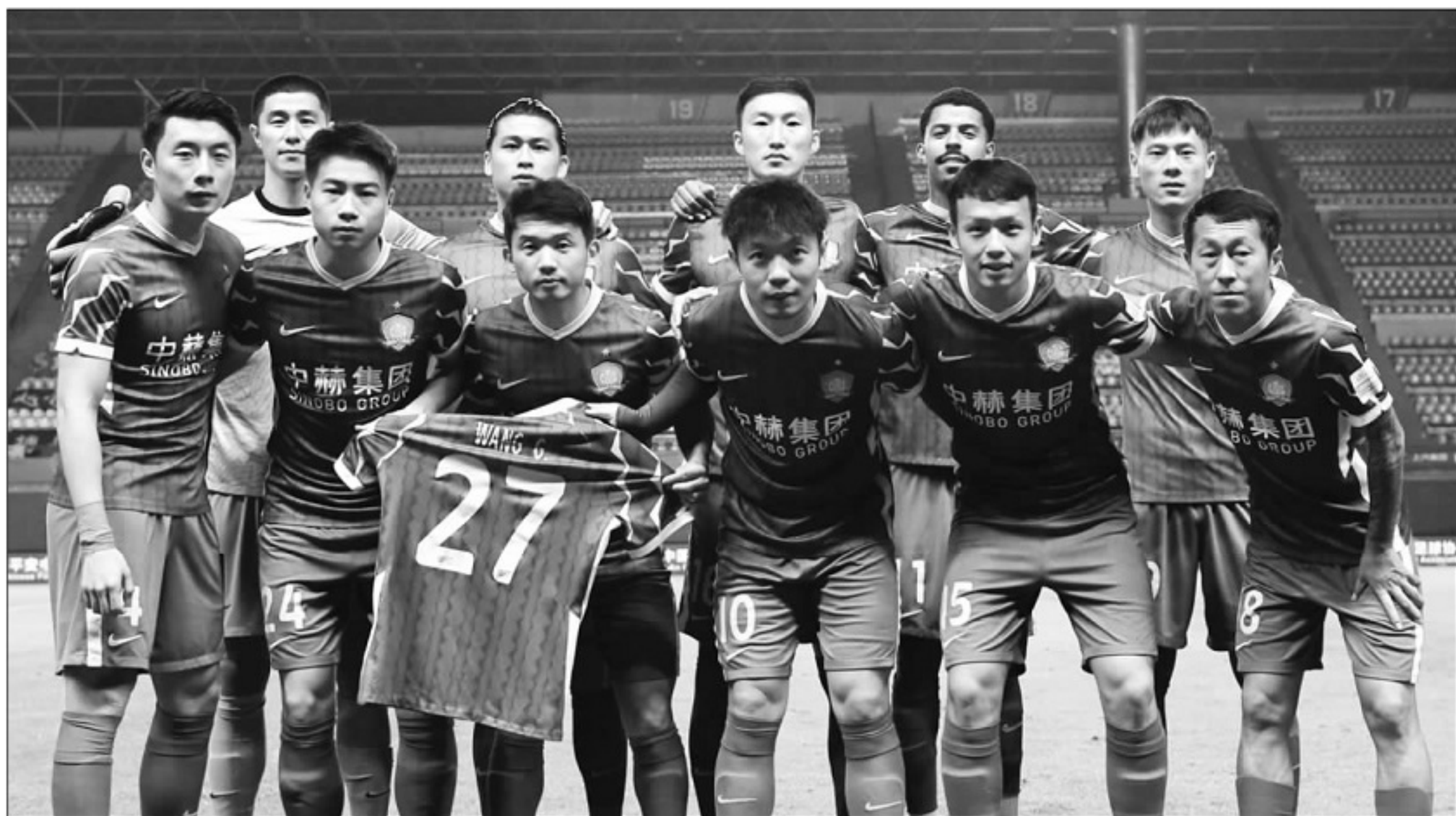
▲0比5惨败于广州城队,北京国安创下了在国内顶级联赛最悬殊比分输球的队史纪录。 图为国安本场首发阵容。