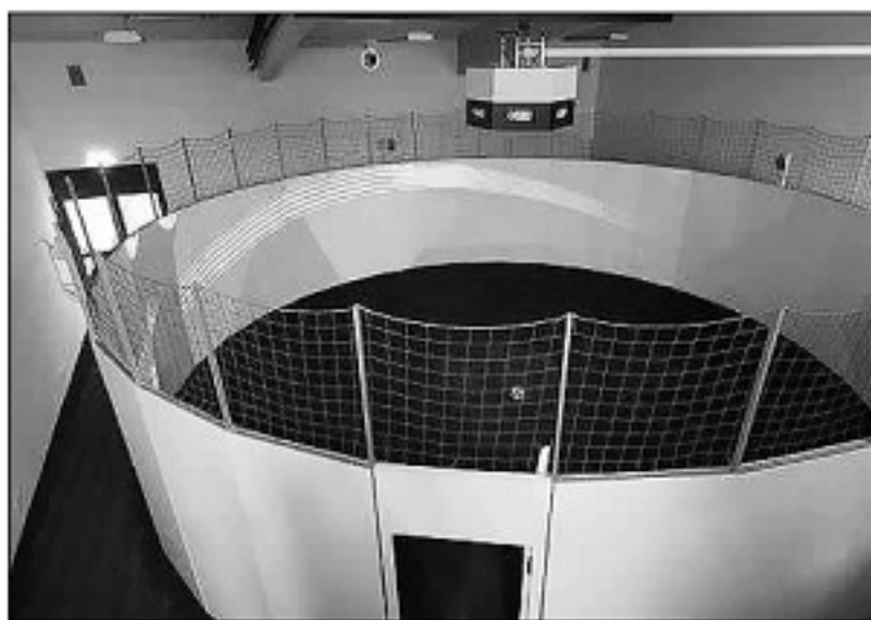
SoccerBot 360 设备全貌。

Umbrella Software 软件公司的商业总监舍勒认为,SoccerBot 360 必将风靡全球,算是“以彼之道还施彼身”,以虚拟的电子游戏环境,来对抗电子游戏对孩子们的诱惑。而且,这个