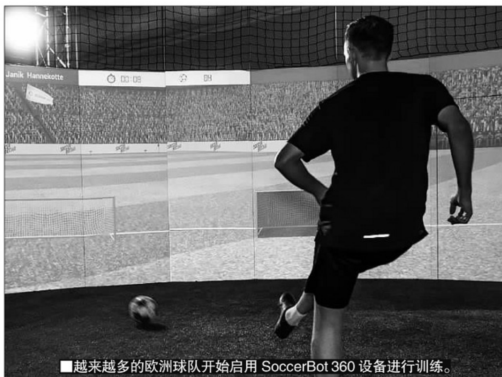
越来越多的欧洲球队开始启用 SoccerBot 360 设备进行训练。

SoccerBot 360 系统对兰尼克的高压迫和高效率足球战术理念,有着重要的辅助作用。兰尼克强调效率第