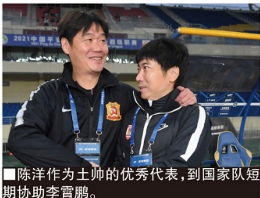
■陈洋作为主帅的优秀代表,到国家队短期协助李霄鹏。

足协副主席高洪波来到净月基地观看全国青少年足球联赛时,也不禁为老东家点赞,基地环境和青训体系都令他竖起大拇指。