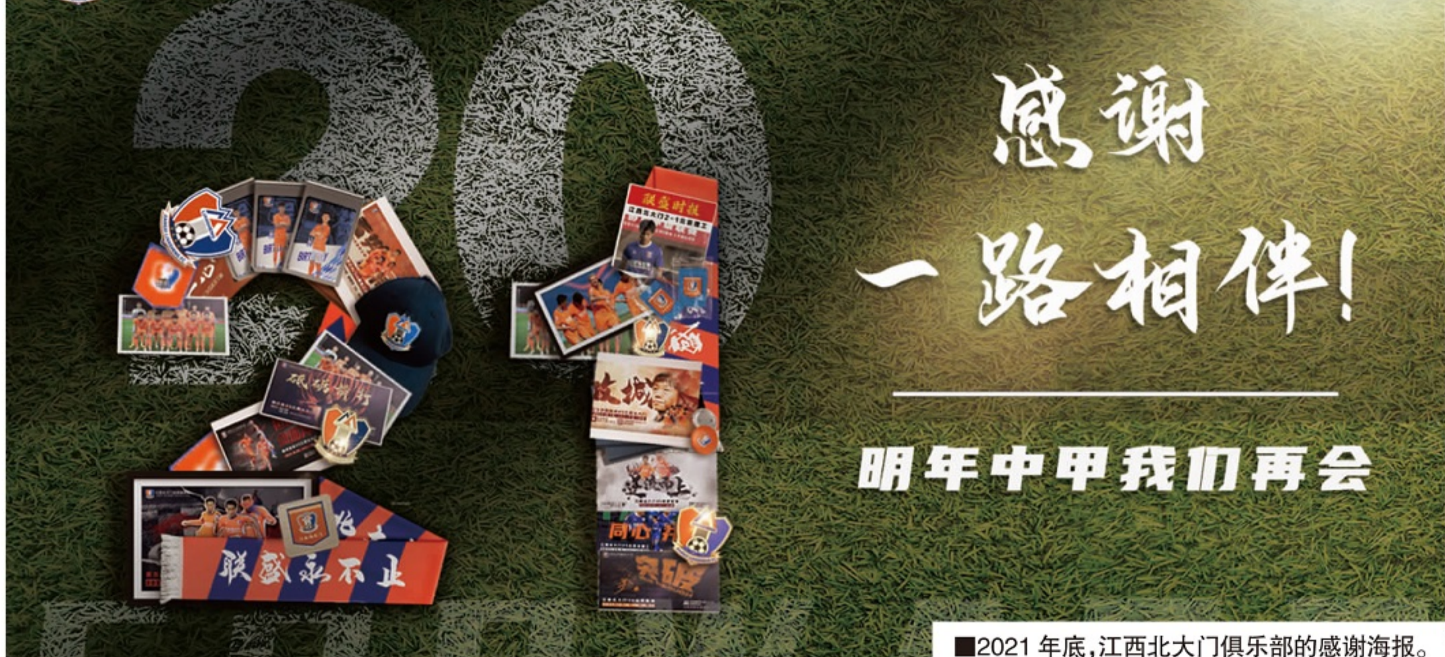
2021年底,江西北大门俱乐部的感谢海报。

江西北大门足球俱乐部 JIANGXI BEIDAMEN FOOTBALL CLUB