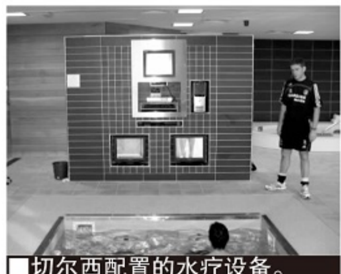
■切尔西配置的水疗设备。

英超俱乐部和英足总训练中心配备的都是HydroWorx公司的设备,包括一个可移动的地板,一个泳池和跑步机、阻力喷射技术以及计算机和摄像系统。通过利用水的自然力量,HydroWorx装置使足球专业人士能够安全有效地为比赛进行交叉训练,并从伤病中恢复。最新的设备泳池尺寸可达12×16英尺,同时泳池长度还有3个4英尺的延长带,可以将泳池增加到12×28英尺。