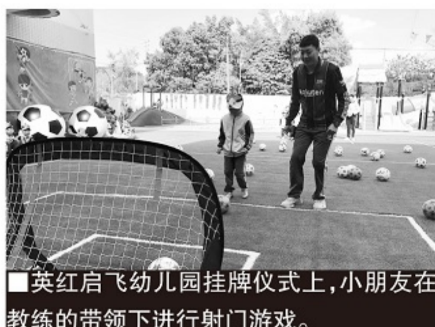
英红启飞幼儿园挂牌仪式上,小朋友在教练的带领下进行射门游戏。

好的东西可以相互借鉴。英德的特色幼儿园每年要给片区和周边县区的幼儿园上一次公开课,然后大家一起交流想