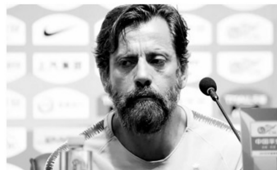
■申花因为拖欠弗洛雷斯薪水并败诉,被足协禁止引援。