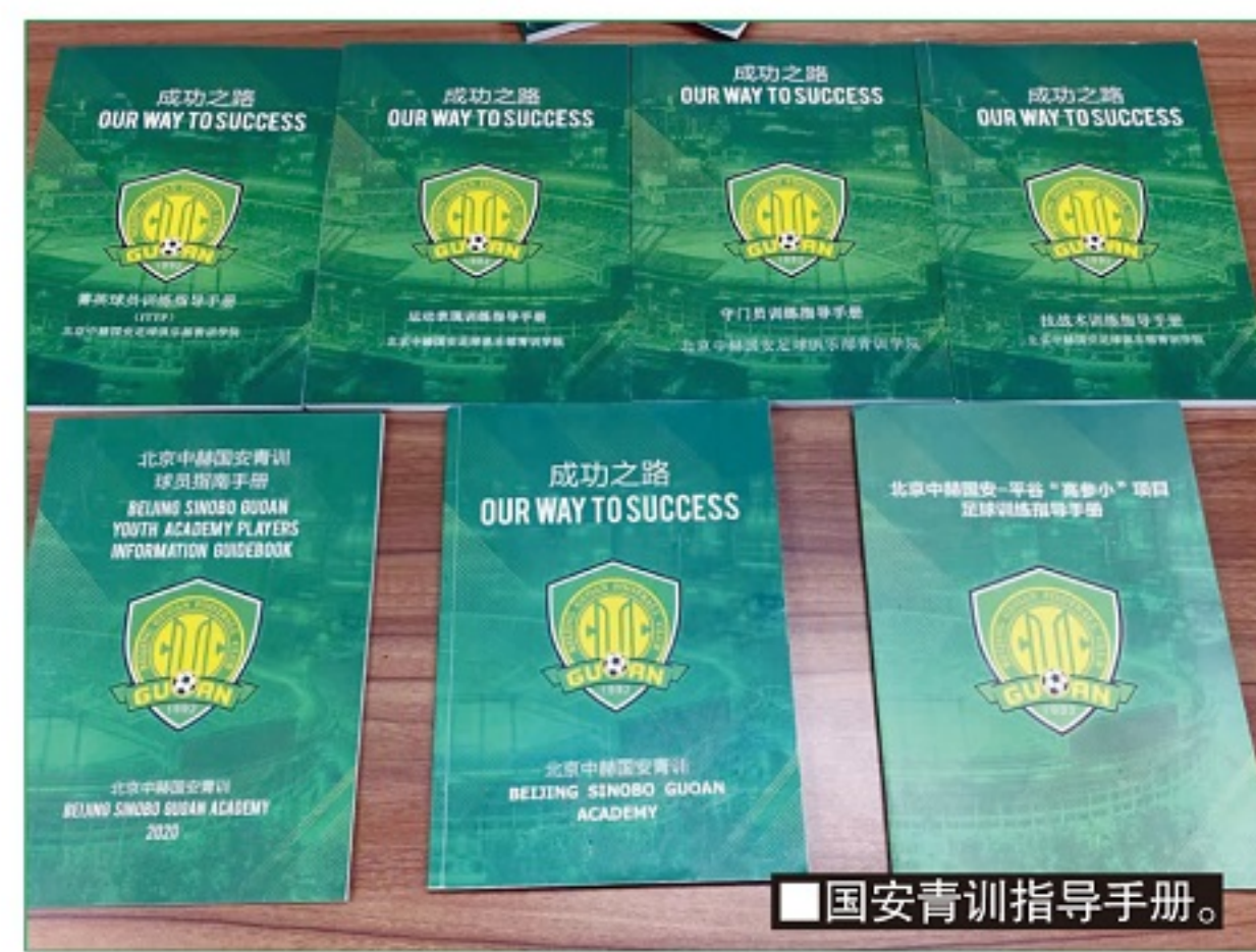
国安青训指导手册。

员之前的日常工作来说,在训练之前没有任何的准备,训练结束之后,可能就回到自己的房间,锁起门来去睡觉,每天就是训练场一房间这样的日常工作,我很难理解,我希望把阿贾克斯的工作环境带到这边来,我们在顺义基地打造了一个办公室,让教练员在那边去办公和日常交流,包括准备自己的训练,给自己的教练组开会,在这之前,可能这些教练员从来没有经历过这些——像正常员工一样,每天到自己的办公室去工作。他们中午需要午休,我尊重中国人的这个习惯,但是午休之后还是要