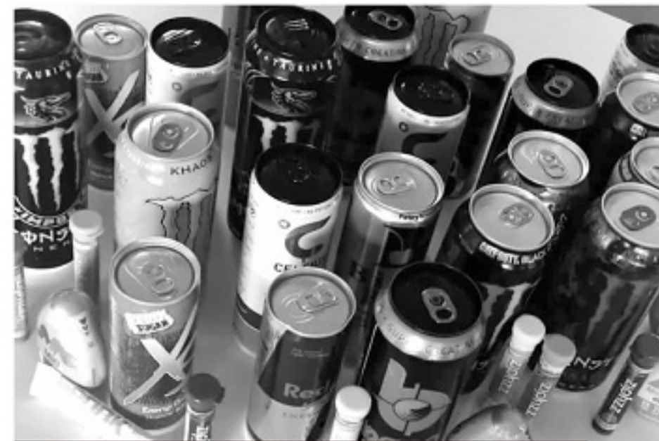
这些国际主流的能量饮料你喝过没?

除了以上十种能量饮料,葡萄适(Lucosade)、爆锐(Powerrade)、佳得乐(Gatorade)因含糖量由高到低,分别被定义为高渗、等渗和低渗饮料,也适合对能量成分有不同需求的业余足球爱好者和职业球员。