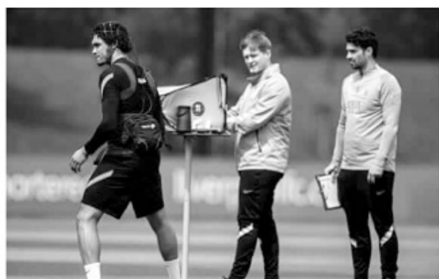
■技术人员在监测阿诺德的训练状态。

克洛普在提升球队技术细节方面近乎偏执，此前他已经聘请过专业的掷界外球教练格隆内马克，帮助提升球队的掷界外球精度与远度。他还聘请德国冲浪运动员斯图德特纳，训练球员在高速和高运动量训练时的呼吸节奏。克洛普一直在不断创新训练手段，追求从细节上提升运动表现。豪斯勒博士的大脑传感训练科技，就是克洛普遍寻各种新奇训练手段中的最新成果。