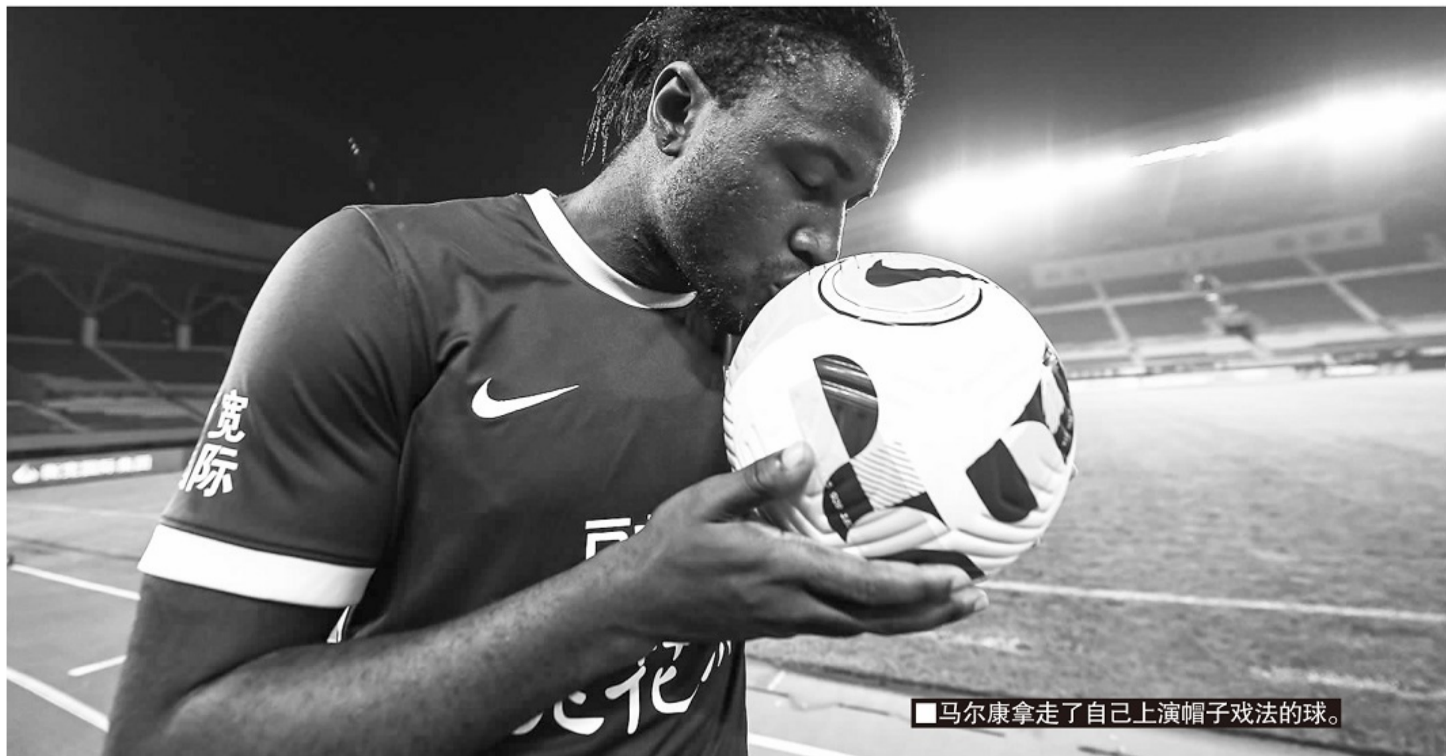
马尔康拿走了自己上演帽子戏法的球。

一球落后并没有打乱申花的防守，整体的统一性比以往有不小的进步。两支球队在这之前都只丢了4个球，并列