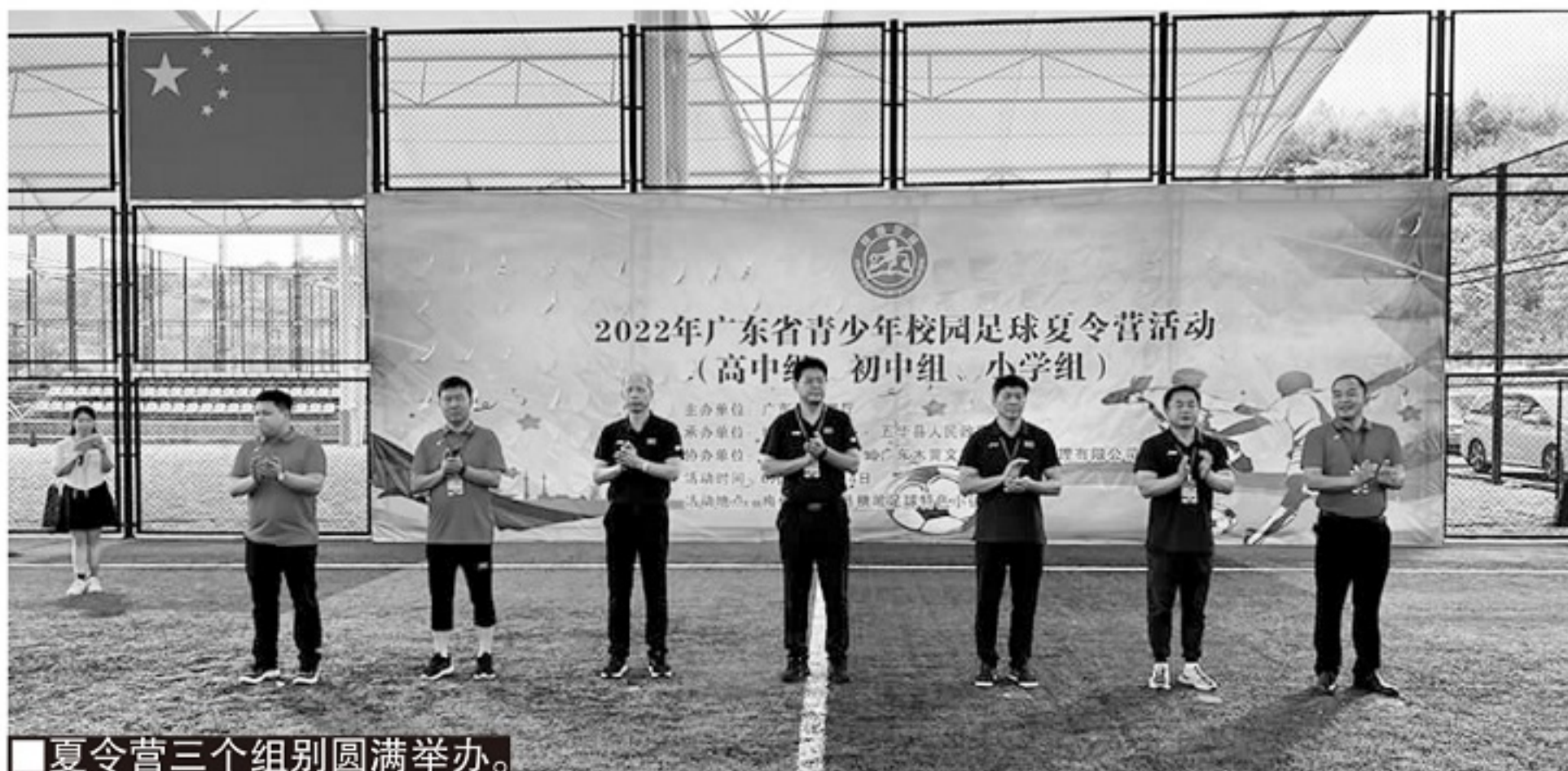
■夏令营三个组别圆满举办。

湛江代表队，是本次夏令营旅程距离最长的代表队。从广东省最西端到五华县，湛江代表队的旅程超过800公里。漫长的旅途中，意外随时可能出现。湛江初中组代表队在前往五华的路上，遭遇了大巴故障，行程因此遭遇了耽误，无法在组委会规定的7月1日18点前抵达小镇报到，并进行落地的核酸检测。