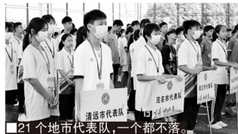
■21个地市代表队，一个都不落。

同时，五华县教育局将相关情况向梅州市教育局和广东省教育厅报告。广东省教育厅委派夏令营组委会两名专家全权负责应急处理。经过和五华县各部门的连夜讨论，专家和夏令营组委会在凌晨两点决定，一早对夏令营运动员、专家、裁判和所有工作人员共546名参营人员进行全员核酸检测。深圳代表队暂时留在宿舍内，由核酸检测人员上门检测。后勤组则负责每天为深圳代表队和单独居住的运动员运送饭食、牛奶和水果等生活物资，保障孩子们能够摄取足够的营养。