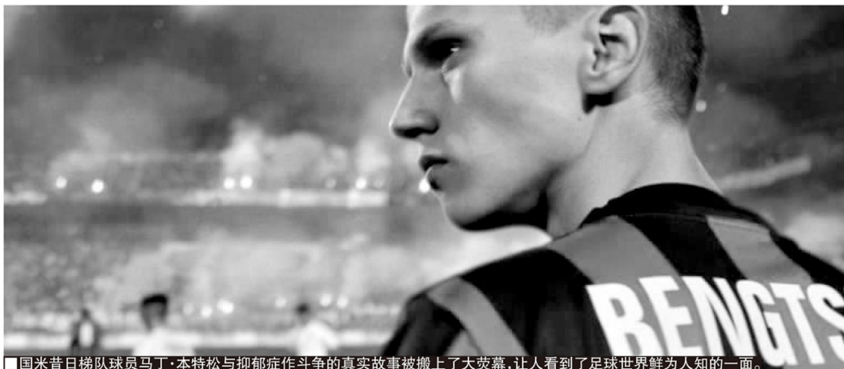
■ 国米昔日梯队球员马丁·本特松与抑郁症作斗争的真实故事被搬上了大荧幕,让人看到了足球世界鲜为人知的一面。

记者寒冰报道 足球在大多数时候都是非常励志的运动,充满着肾上腺素分泌带来的热情和多巴胺带来的喜悦——但并不是每次都这么热血。至少,对于曾效力国际米兰的瑞典球员马丁·本特松而言,足球带给他的阴影,远多于阳光。他曾被视为下一个鲁尼或伊布拉,却在签约国米梯队9个月后受伤并患上抑郁症。