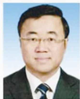
习骅 驻体育总局纪检监察组组长、 党组成员