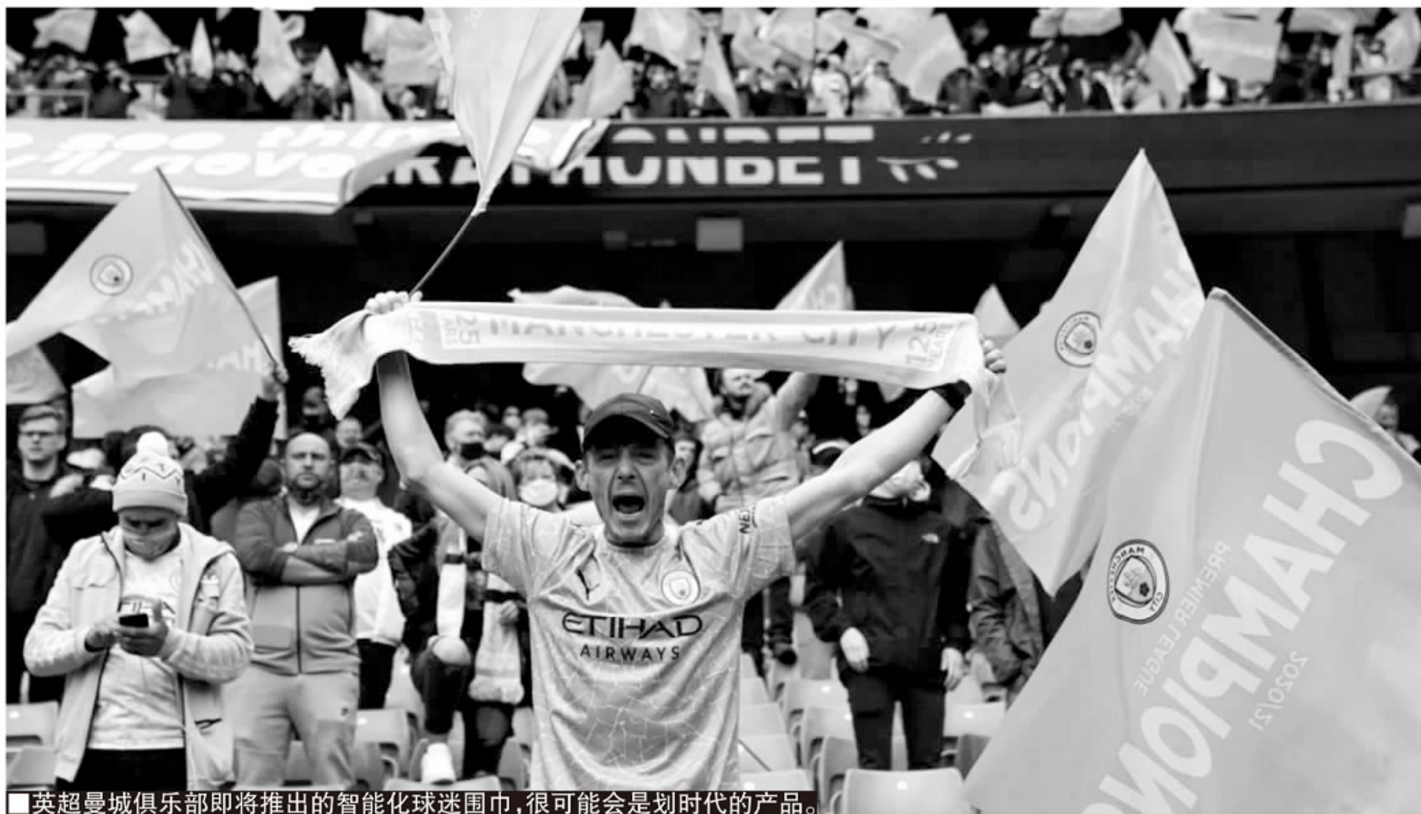
■英超曼城俱乐部即将推出的智能化球迷围巾,很可能是划时代的产品。

记者寒冰报道 提及最近 10 年风靡职业足球界的高科技可穿戴设备,基本都是职业球员专属。这些设备由高科技公司开发,用于提升顶尖球员的训练和比赛状态,或通过大数据分析提升球员和球队的表现,以及加速他们的运动康复。虽然不少可穿戴设备已经实现价格上的平民化,但从根本上看仍然是顶级球员和球队的“特权”。