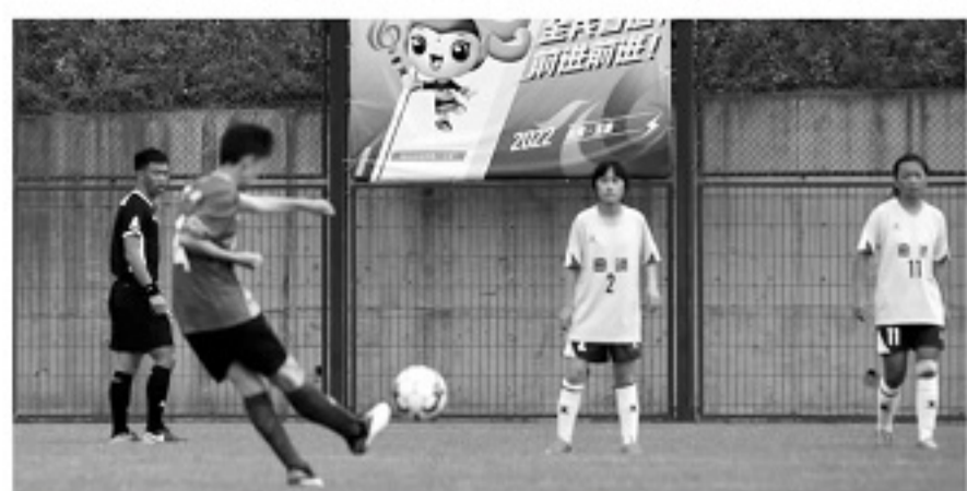
■云南省运会女足甲组首轮,楚雄一球不敌曲靖。