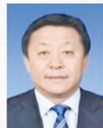
杜兆才 副局长、党组成员