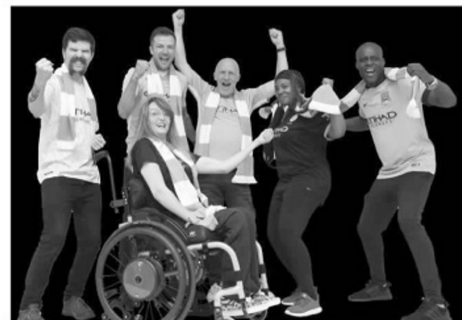
■智能围巾涉及到收集生物特征数据,用户的隐私该如何保障会是另外一个问题。

如何增强球迷对现场观赛的热情,进而让更多年轻人喜欢足球,足球界始终在不断努力。高科技原本就不应该只属于顶尖俱乐部和球员,而应该属于所有喜爱足球的人。顺应“元宇宙”和社交网络化的时代趋势,为他们带来前所未有的快乐,提供前所未有的保障。与科技进步对抗没有任何意义,与科技进步同频,融入年轻人的世界,以他们的方式改进足球世界,才是赢得“争取年轻人”这场战争的关键。