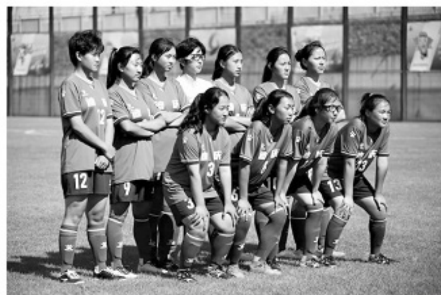
■本届云南省运会首轮,迪庆U17女足首发阵容。

对抗和团队激励。“我们可能在身体素质、跑动能力上占一点点优势,但技术上会比外地球队弱一些,所以我们扬长避短。”谈到球队勇于拼搏的传统时,她说不知道为什么,总之“一到场上我们就会特别亢奋、比较激动”。