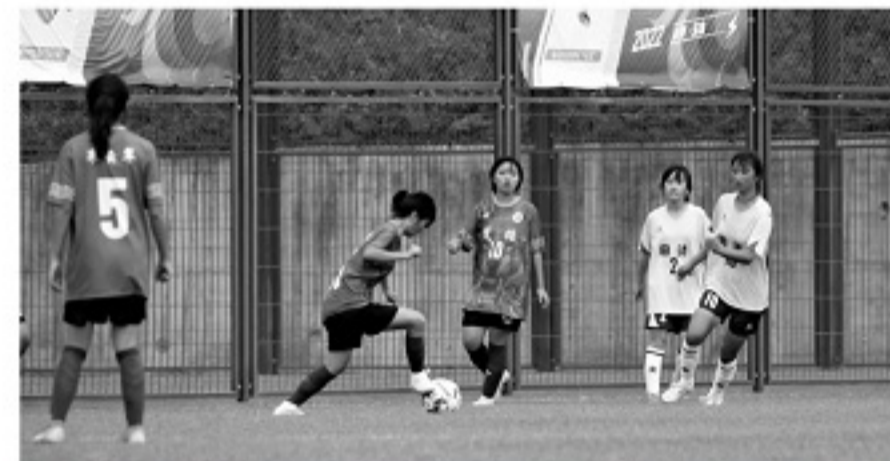
■在玉溪举行的首轮比赛,楚雄女足表现不在状态。

作为校园足球的身体力行者,他对普及过后的提高充满期待,认为离云南较近的成都、重庆的女足精英训练明显走在前