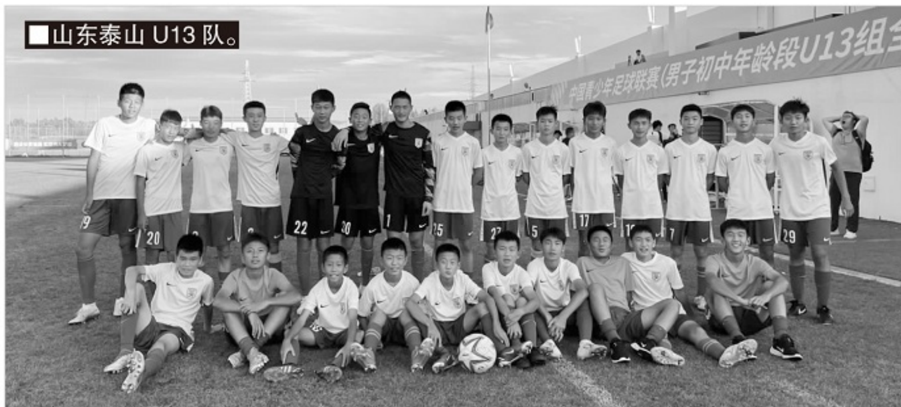
■山东泰山 U13 队。

和于远伟、韩鹏及周海滨相比，山东泰山 U13 队主帅汪强身上的压力更大一些，因为山东泰山 U13 队相对整齐，不像