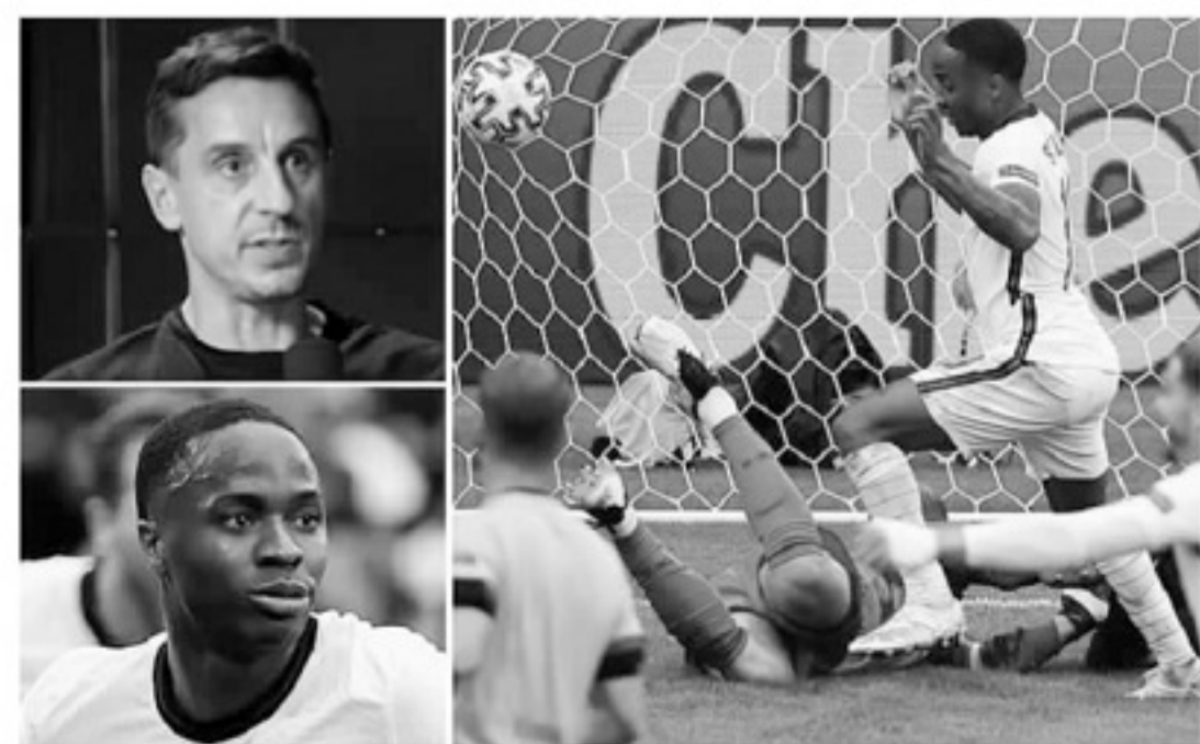
■加里·内维尔在去年欧洲杯期间，曾因突发心肌梗塞而被送往医院。而天空体育透露，斯特林在比赛中也曾出现心脏不适的情况。

退役的阿圭罗还在幻想自己能重返绿茵场，但他更应该接受 Idovent 平台的人工智能检测，认清事实再做决定。哪怕埃里克森有植入式心脏起搏器，帮助他重返赛场，足球世界也应该非常清楚：生命，始终是高于足球的存在。