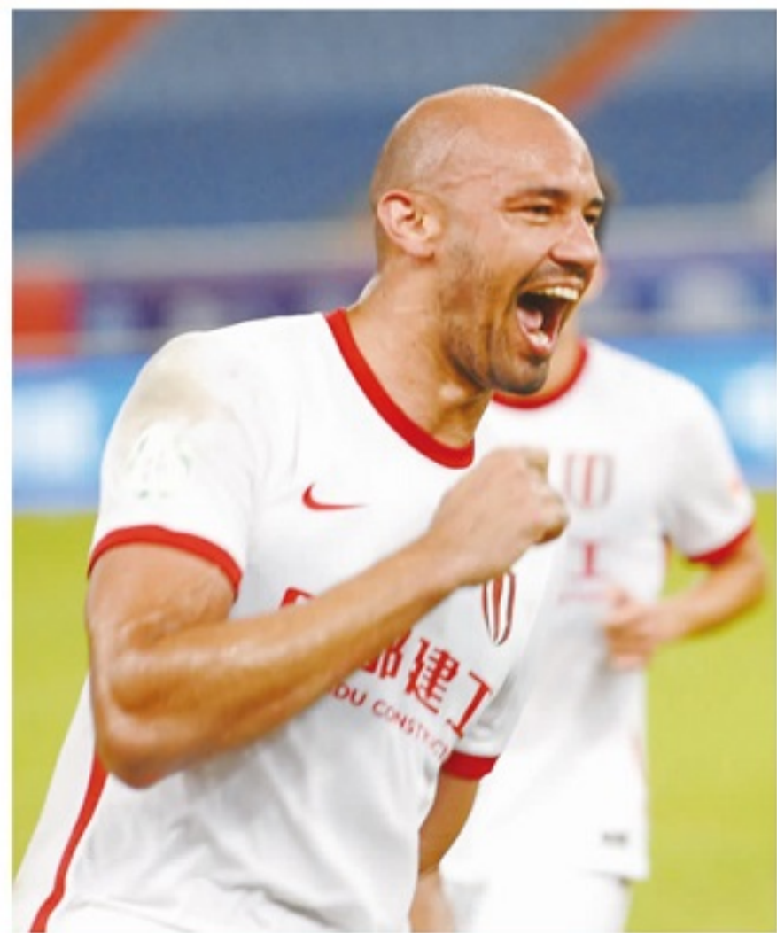
■费利佩连续4场比赛进球，可惜未能帮助蓉城拿分。

虽然对手是卫冕冠军，排名也很高，但蓉城没有被对手吓到，对于他们来讲，能扛住就是胜利。从整体实力上来讲，泰山完全在蓉城之上，在控球及进攻机会上的优势，也非常明显，但这都在蓉城主帅徐正源的预料中。