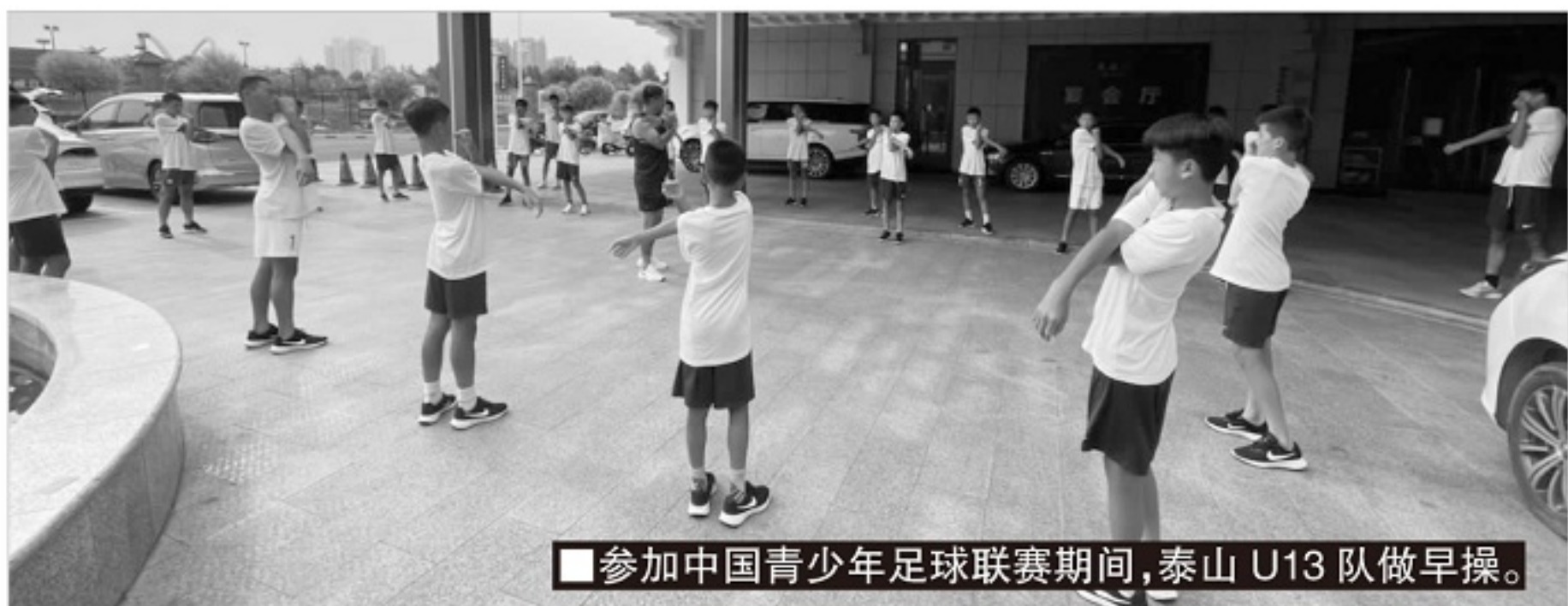
■参加中国青少年足球联赛期间，泰山 U13 队做早操。

另外三支球队那样缺兵少将，这反而带来了压力。此外，U13 组别作为中国青少年联赛全国性比赛的起始组别（小学组不进行全国总决赛），各队之间相互并不熟悉，