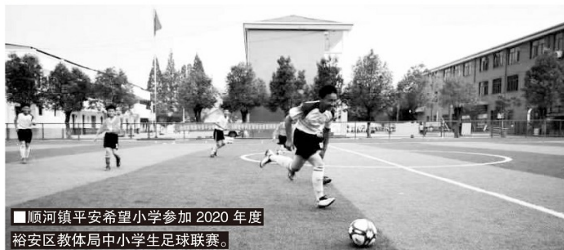
■顺河镇平安希望小学参加2020年度裕安区教体局中小學生足球联赛。

内心的喜爱足球。“那种喜爱不是你命令他,要求他怎么做,而是他们自己发自内心的喜爱。”张军说。