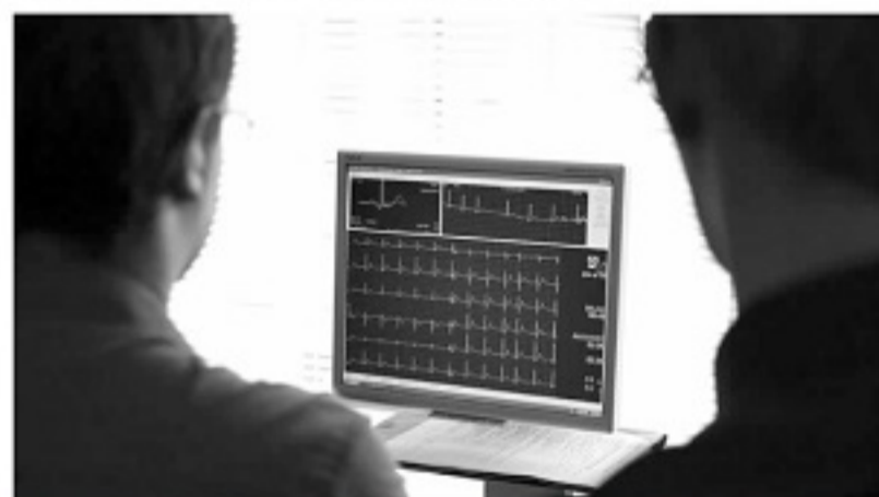
■人工智能的介入将大大解决球员心脏疾病问题。

总部位于马德里的 Idovent 公司，未来有望对整个欧洲乃至世界足球产生重要的影响。卡西利亚斯作为皇马基金会高层和联合国开发计划署大使，将 Idovent 称为“拯救了我生命的人工智能”，他认为该公司的科研能促进球员心血管疾病的早期发现和干预，降低心脏病或心源性猝死的高风险。Idovent 公司建立了可能是世界上最大的人工智能心电图数据库，公司拥有心脏病学、统计学、人工智能领域的专家和运营团队，还与拥有17个心脏病研究中心的泛欧 MAESTRIA 联盟合作，帮助后者得到了美国地平线2020基金1400万欧元的资助。