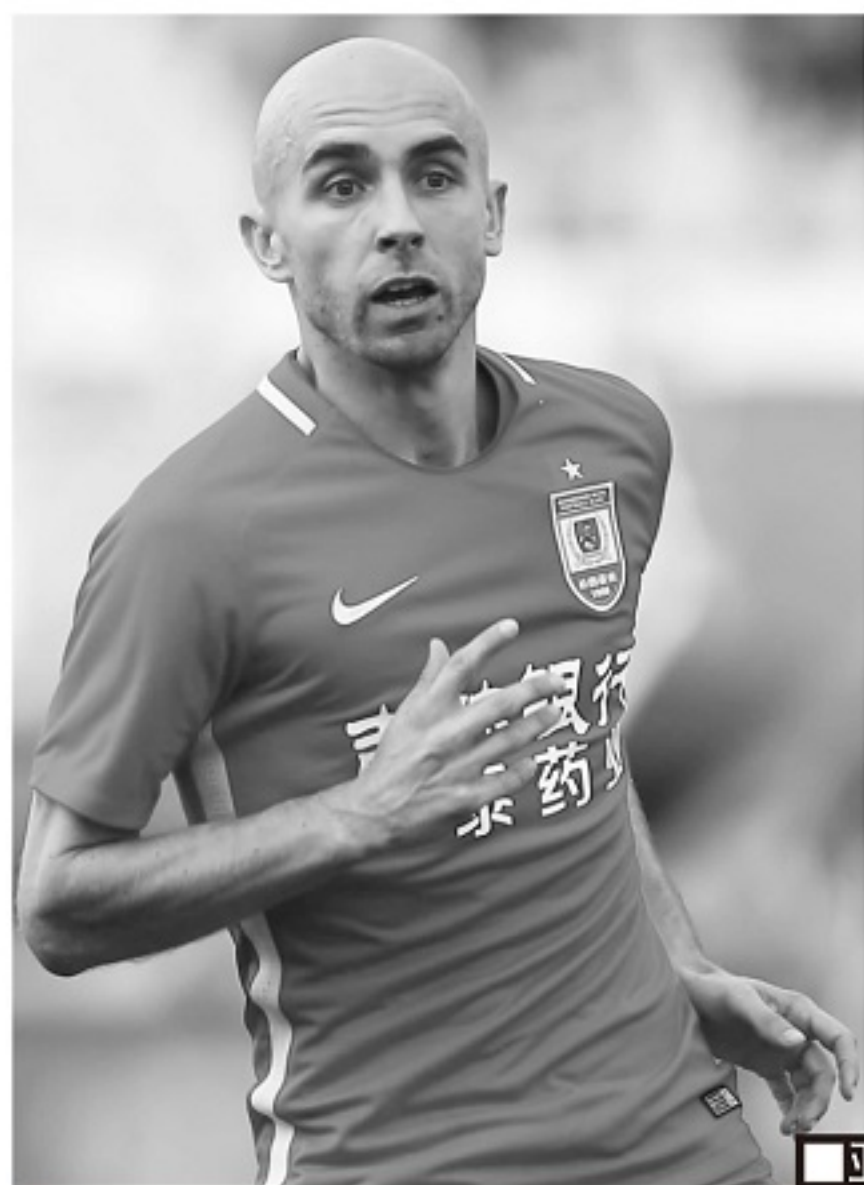
■ 亚泰,是阿德里安在中超效力的第一个俱乐部。

托马斯(皮纳)在西甲出场超过了300场,是一个非常经验丰富的球员,他的踢球风格,我觉得更像巴萨的布斯克茨,是掌控中场节奏的,什么时候快,什么时候慢,