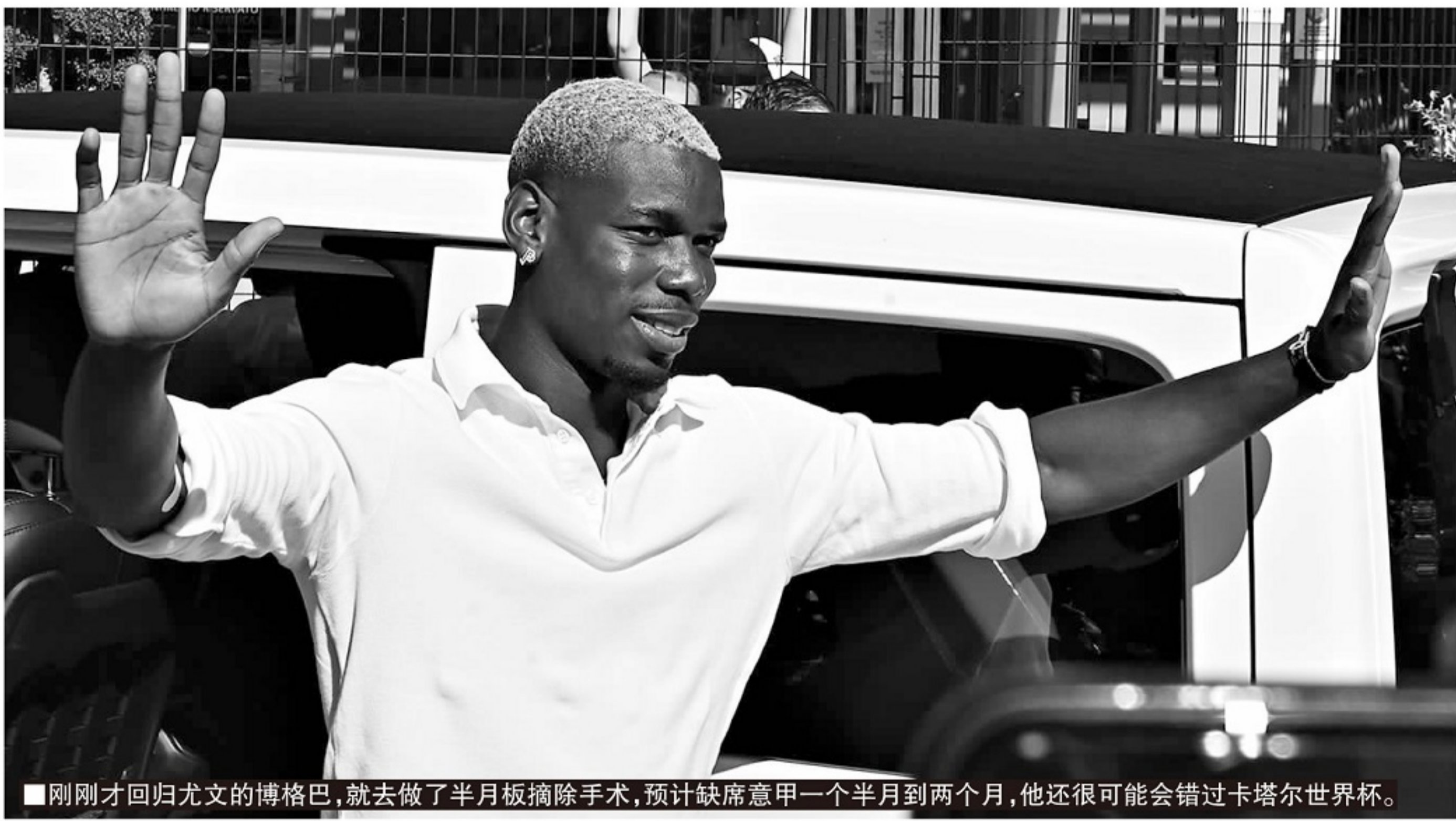
■ 刚刚才回归尤文的博格巴,就去做了半月板摘除手术,预计缺席意甲一个半月到两个月,他还很可能会错过卡塔尔世界杯。

记者寒冰报道 过去1周,博格巴的右膝半月板摘除手术成为了世界足坛的焦点。普通球迷或许有所不知,半月板是职业球员最容易出现重大伤情并需要进行手术的部位。这两块主要功能是减震的软骨(内侧和外侧半月板),几乎可以直接决定球员的职业生涯。博格巴只是半月板伤势最新的受害者之一,法国巨星很可能会因不得不进行的手术而错过卡塔尔世界杯,同时他还因手术得罪了法国国家队和尤文图斯两大团队,为自己的职业生涯蒙上了阴影。