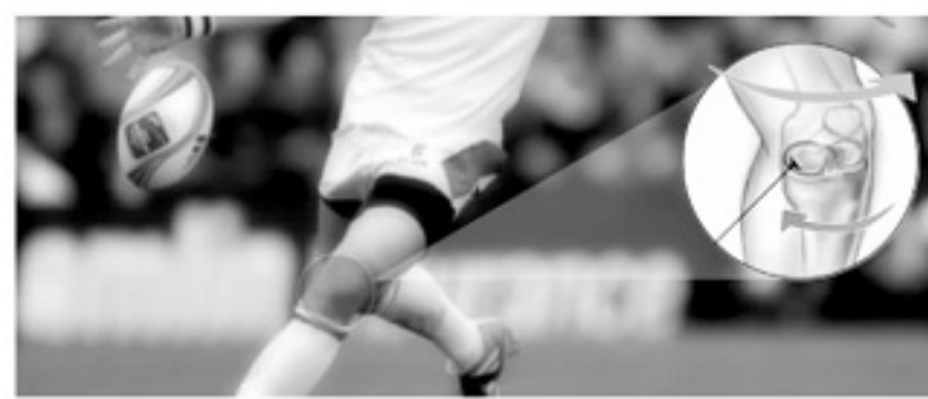
■ 在职业球员所有需要动手术的重大伤病中,半月板损伤占到的比例是最高的。

博格巴这样的精英运动员,完成半月板软骨切除术后的康复会更快,因为他可以得到比大多数球员更好的术后康复条件。但对于其他职业球员或业余足球爱好者而言,尽可能避免半月板受伤是延长运动生涯的关键。毕竟,统计显示业余爱好者无论半月板受伤概率还是康复时间,都比职业运动员更高,更长。