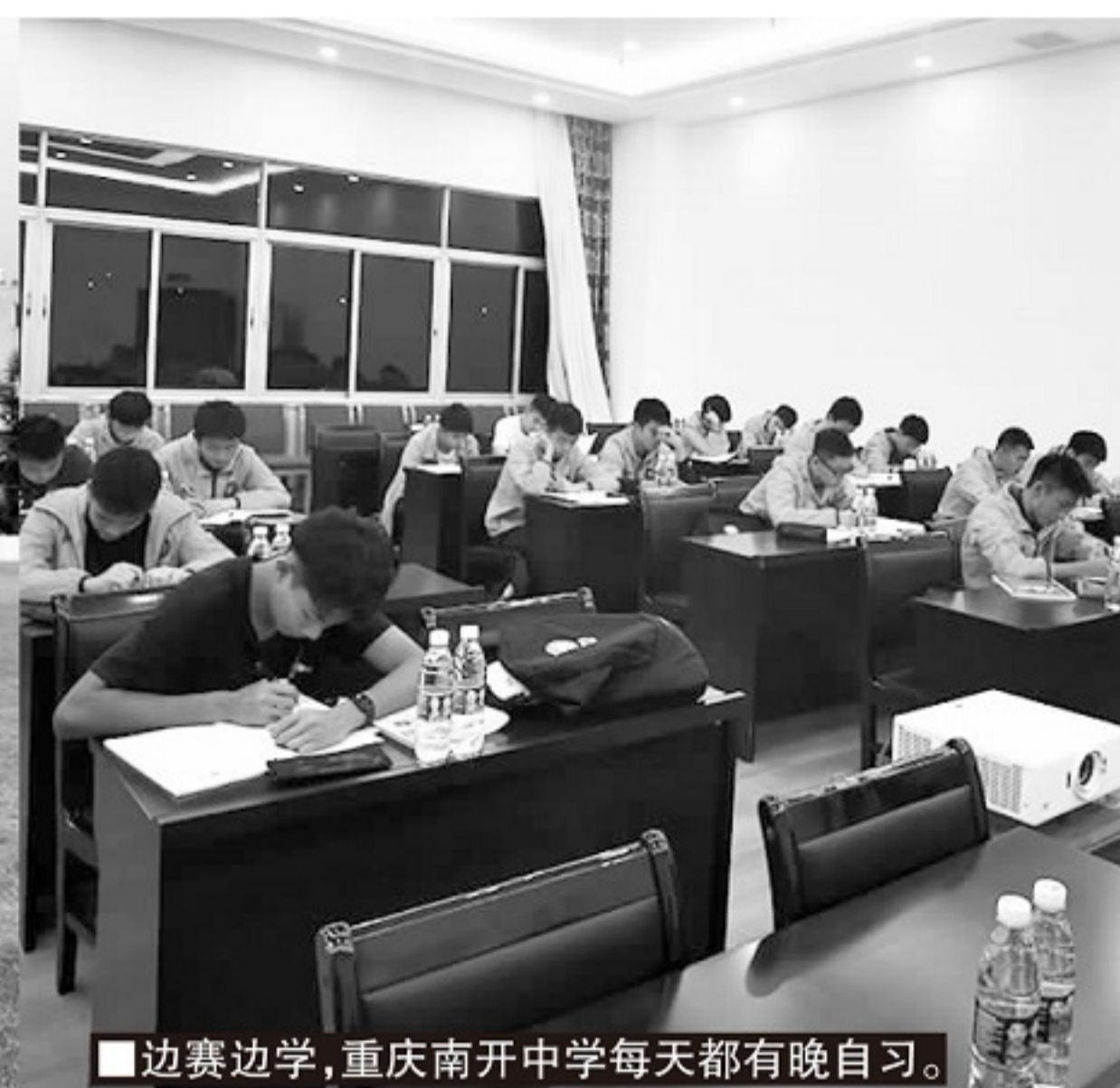
■边赛边学,重庆南开中学每天都有晚自习。