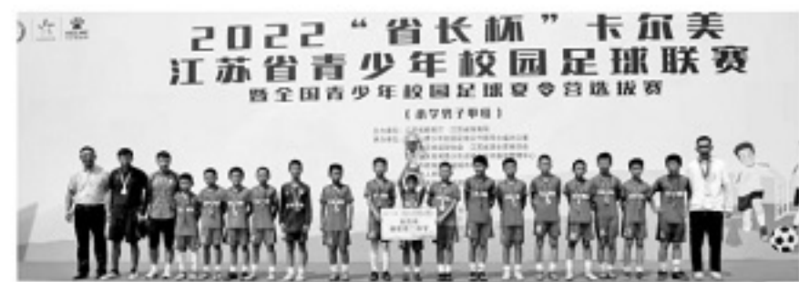
“杯”卡尔美江苏省青少年校园足球联赛

2020年以前,苏州没有中超比赛,也几乎没有承办过国家队的比赛,但随着中超联赛和世界杯预选赛落户苏州,让大家