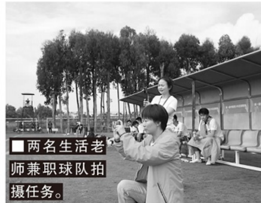
■两名生活老师兼足球队拍摄任务。

依托86年的积淀,该校对校园足球的育人功能进行了深层次思考,围绕“允公允能,日新月异”的办学思想,把足球育人有机融入“公能”育人体系之中,把足球精神渗入学校精神之中,把足球文化融入学校文化之中。