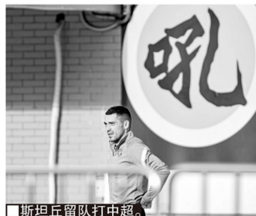
■斯坦丘留队打中超。

不过,球队每赢下一场比赛,都在创造球队的历史,如果继当年的广州之后,再制造一个“凯泽斯劳滕奇迹”,对于俱乐部对于球队所在武汉市来说,将是莫大的荣耀。