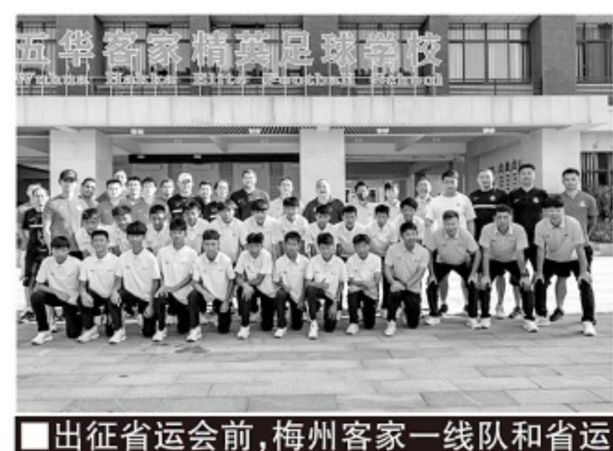
■出征省运会前,梅州客家一线队和省运队合影。

川合学说:“日本青少年足球队的第一身份其实是学生。比如横滨水手的梯队队员未来有三种发展方向,参与梯队训