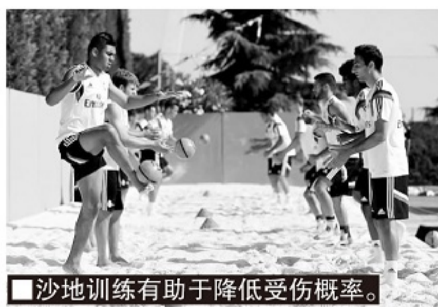
■沙地训练有助于降低受伤概率。

沙地的柔软表面带来的减震效果,意味着降低了身体感受到的压力,自然减少了身体受伤的可能性。当球员持续暴露于相同的压力源时,过度训练将导致受伤的风险增加。此外,偶尔进行沙地