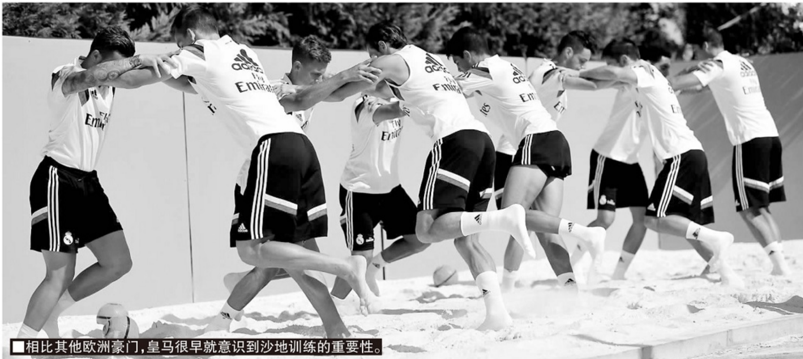
■相比其他欧洲豪门,皇马很早就意识到沙地训练的重要性。

记者寒冰报道 进入21世纪,整个运动医学界都在寻求与高科技的结合,定位器为核心的数据收集、人工智能分析、超低温冷疗……几乎成为帮助球员更好提升训练、比赛状态、预防伤病和加速康复的主流手段,足球运动正在成为被高科技包裹起来的精英运动。