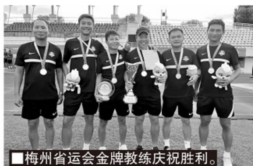
■梅州省运会金牌教练庆祝胜利。

值得一提的是,代表梅州市参赛的五支男足队伍中的四支是下放到梅州客家足球俱乐部的球队,分别是07、08、09、10年龄段的队伍,他们共拿下六枚金牌,在金牌总数上创造了纪录。梅州市上一次夺得省运会男足冠军,还是24年前,在1998