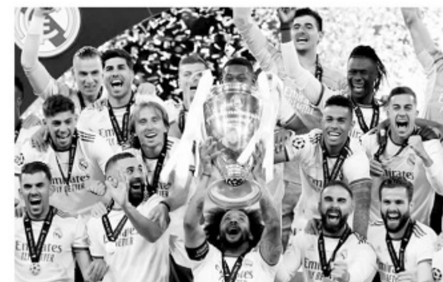
■皇马近9个赛季5夺欧冠,日常的沙地训练功不可没。

英格兰职业联赛对沙地训练的忽视或者说缺乏认知,可能会在不久的将来对英格兰职业足球产生不利的影响。相比之下,拉丁世界的职业足球对沙地训练更重视,皇马就是最好的例子。安切洛蒂第1次执教皇马时,沙地训练就已是皇马训练课必不可少的内容。通常会在上午的体能训练中进行,球员们首先在沙地上热身,调动全身的肌肉群,然后再进行跨栏练习充分拉伸双腿。之后,才是分组的有球训练。皇马能在最近9个赛季中拿到5个欧冠奖杯,看似普通的沙子也是成功的基础之一。